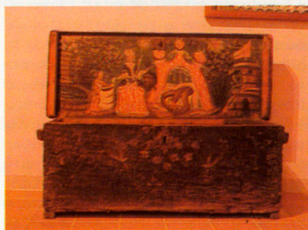
Caixes marineres al Museu d'Arenys de Mar. De fet, aquests baguls eren les maletes dels mariners que ells mateixos decoraven amb les pintures que podem contemplar.