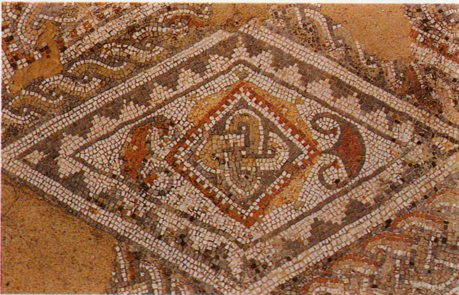
Fragment de mosaic romà de Torre Llande a Mataró.

En la divisió territorial de Catalunya del 1936 es donà el nom de Maresme a aquesta estreta faixa de terres situades a llevant de Barcelona, entre la Serralada Litoral i el mar, que van des de Montgat fins a la desembocadura de la Tordera. Són uns terrenys oberts al mar; d'ací el nom de Marina, Maresma o Maresme que històricament han rebut, bé que la seva part de llevant també hagi estat inclosa dins la comarca de la Selva. I és que d'antic aquest territori resultà sempre dividit en dos sectors. L'un —a ponent— sotmès a l'àrea d'influència de Barcelona, i l'altre —a llevant— a la de Girona. La partió era a Caldes d'Estrac, al centre de la regió, fent frontera entre el comtat, la vegueria i el bisbat de Barcelona, i el comtat, la vegueria i el bisbat de Girona (ardiaconat de la Selva); també fou el límit del vescomtat de Cabrera i separà després els corregiments de Girona i de Mataró. Per tot això hi ha també qui l'acostuma a dividir en Alt i Baix Maresme, però és una cosa que es fa més aviat com a recurs metodològic per a l'estudi dels trets diferencials entre els dos sectors.