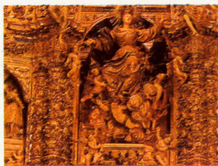
Retaules de l'església d'Arenys de Mar.