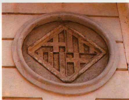
Diferents escuts del Portal de Barcelona a Mataró.

havien de caracteritzar l'anomenat segle d'or de la marina velera catalana (1790-1870). Ara, en aquesta nova etapa, la marina havia de florir al Masnou i a Vilassar, on també es crearien escoles de pilots. Amb tot això el Maresme assoliria els 70.000 habitants el 1860. S'havia format el nou terme municipal del Masnou, que absorbí una part dels termes de Teià (1812) i d'Alella (1846); el de Cabrils, separant-se de Vilassar de Dalt (1833); el de Premià de Mar, que se separà de Premià de Dalt (1836), i el de Santa Susanna en separar-se de Malgrat (1860).