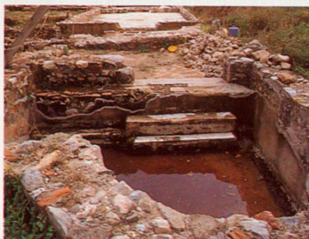
Excavacions a les termes romanes de Mataró.