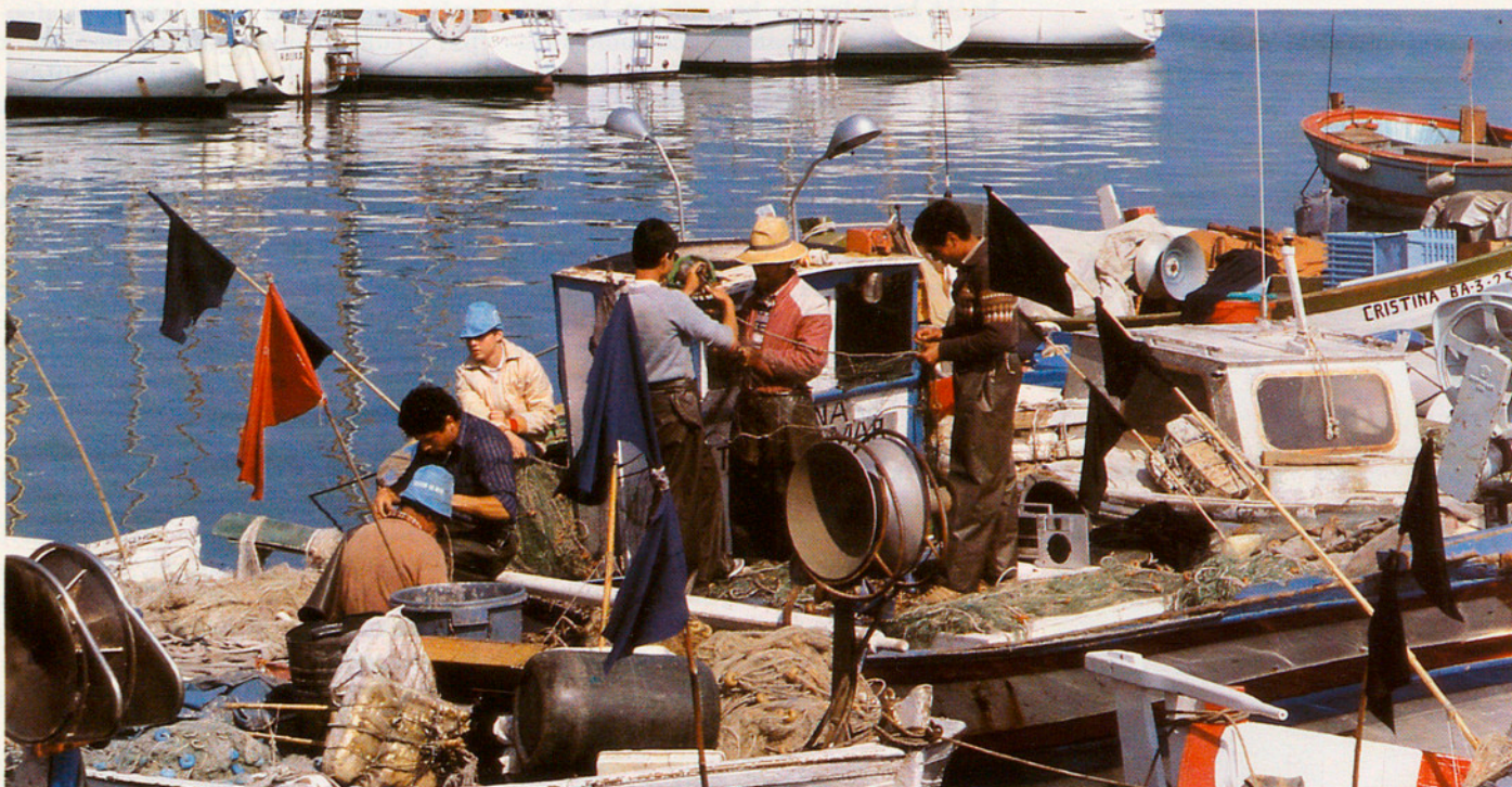
El treball i el lleure. Els pescadors i els iots s'apleguen al port d'Arenys de Mar.