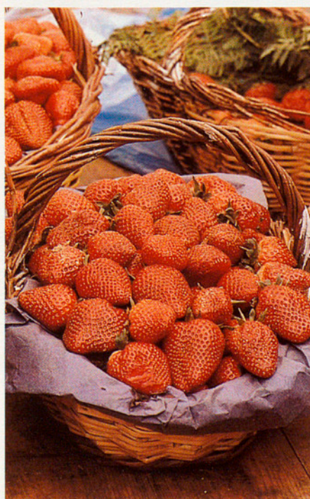
El conreu del maduixot representa aproximadament el 12% de la producció agrícola del Maresme.

sortida que transformar-se en regadiu progressivament. En cas contrari, aquestes terres han estat edificades o hi ha l'expectativa que ho siguin i, per tant, resten ermes i plenes de brolla.