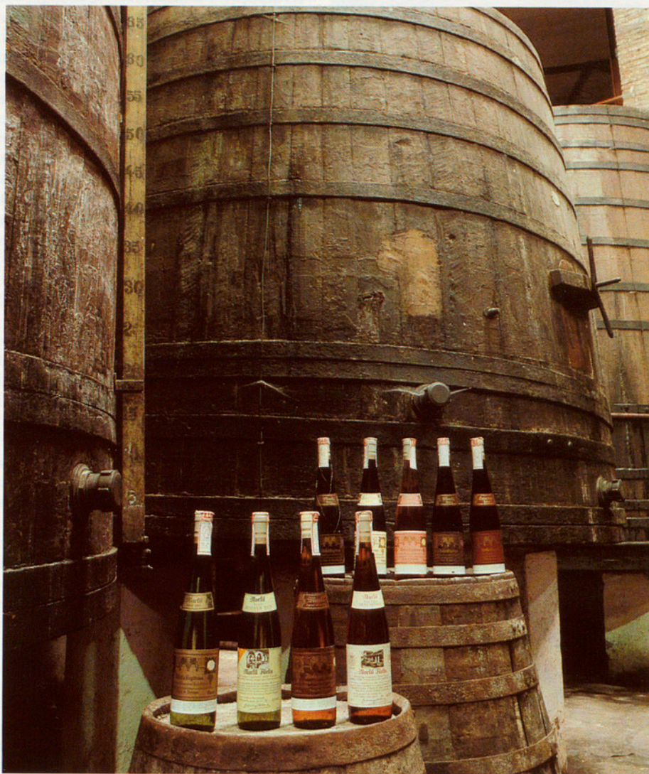
A la tradició cal afegir les modernes tècniques de comercialització.

un increment de llocs de treball, factor a tenir present a l'hora de valorar rendibilitats, ja que aquest té una incidència mitjana del 40 % sobre el PBV. És, doncs, important que junt a un increment de producció se cerqui una major productivitat.