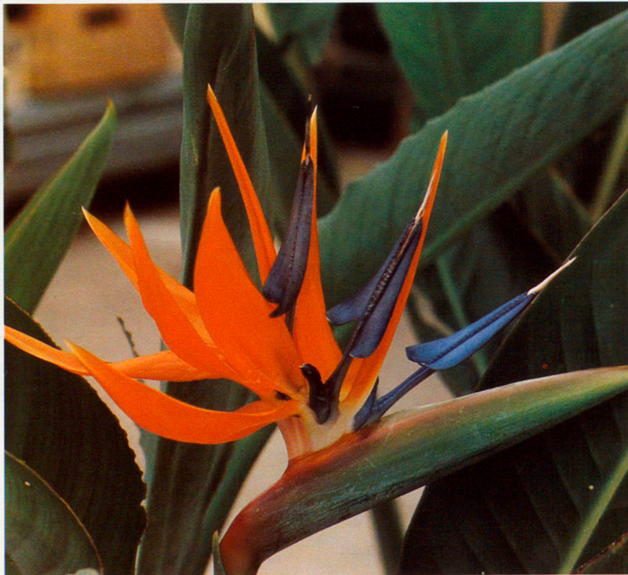
Detall d'una de les espècies de flor conreades al Maresme.

Josep Montasell. Enginer Tècnic Agrícola. Unió de Pagesos de Catalunya.