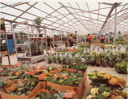
Diferents seqüències del procés de conreu de les flors.