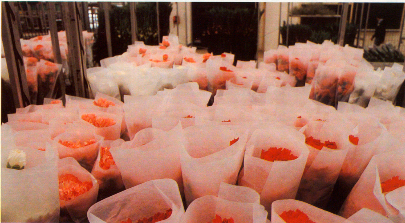
L'agricultura és un dels sectors més importants, per a l'economia del Maresme.

El conreu de la vinya per a la producció, bàsicament, d'aiguardents, el progrés del garrofer i de l'horta, juntament amb el conreu del taronger són els aspectes més destacables dels segles XVIII i XIX, sempre sobre la base de la petita explotació agrària. L'aparició de la plaga de l'oidium a la meitat del segle XIX i la invasió de la fil·loxera en el darrer terç del segle provoquen una reducció dràstica de la superfície dedicada a la vinya i un increment de la de patata primerenca. A partir de 1932 comença el procés exportador de patates a Europa, comercialitzades amb la denominació d'origen Mataró Potatoes.