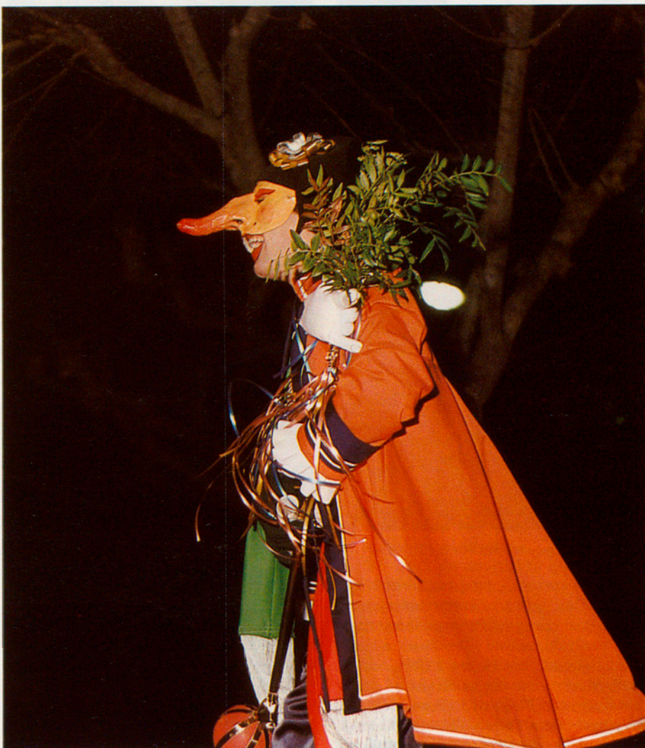
En Pellofa, rei del Carnestoltes mataroní.

Si bé el Carnestoltes és un cicle que actualment comença el Dijous Gras i arriba al Dimecres de Cendra, antigament en començaven les primeres manifestacions molt més aviat i quan prenien força era els dos dijous abans del gras, el de Comares i el de Compares. Aquests dies a Arenys de Mar, fins al final del segle passat, havia començat el Ball de Cançons, danses senzilles al so d'una cançó que ballaven diverses colles tot recorrent la vila. Semblantment, en altres poblacions costaneres com Calella, Sant Pol i Canet dansaven