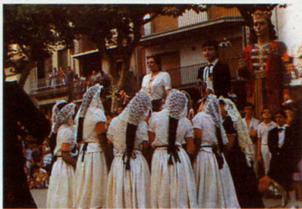
La dansa d'Arenys per la Festa de Sant Roc.