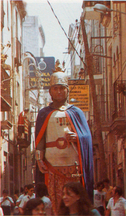
En Robafaves per les Santes de 1979.

Quaresma sortís una capta infantil, les Serra-Velles, que anava per les cases i alhora que cantaven una cançó imitaven l'acció de serrar. A les cases solien donar-los ous, botifarres i llaminadures. A Mataró encara se celebra, i cada diumenge, a la Plaça de la Peixateria, se serra una cama de la vella, que hi està exposada tota la Quaresma. També tenia lloc aquests dies el salpàs, un ritu de purificació contra els mals esperits, que consistia a esquitjar sal humida a les parets de l'entrada de la casa.