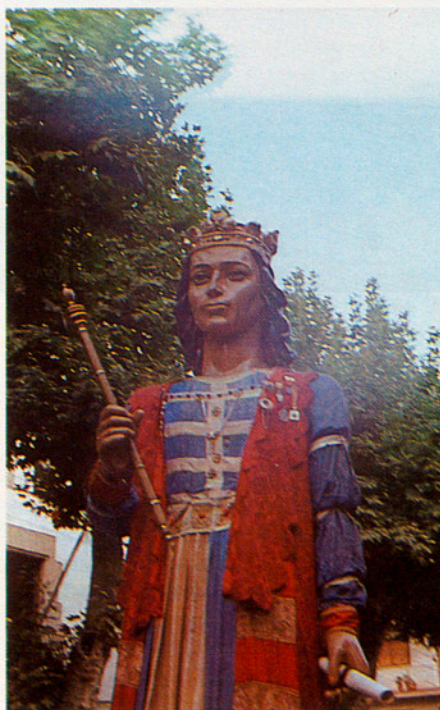
En Tallaferro, gegant arenyenc.