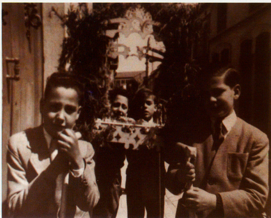
La festa de la Santa Creu a Mataró. Concurs de Tabernacles.

Cal assenyalar que en aquest àmbit geogràfic la pèrdua de les tradicions i costums s'ha esdevingut abans que en molts altres llocs de terra endins. Les comunicacions marítimes i ferroviàries han fet avançar en la modernitat i els nous costums les poblacions costaneres. Així doncs, en molts casos parlarem de costums ja apartats per la cultura popular d'avui. No pretenem ser exhaustius amb les poques pàgines de què disposem i per això poden produir-se algunes omissions.