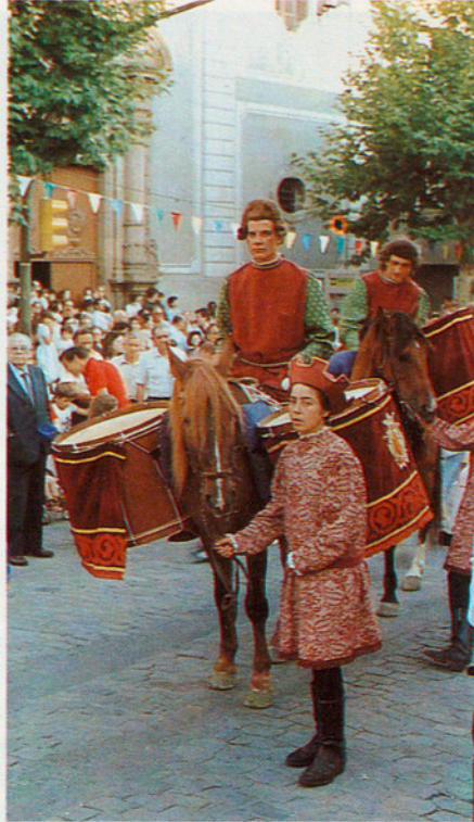
Les Trampes i l'Herald del dia de les Santes.

La nit de Pasqua se surt a cantar caramelles en llocs com Mataró i antigament a Sant Pere de Riu. A Sant Vicenç de Montalt, el cor parroquial ho fa l'endemà. Aquest és un dels costums que possiblement es perdran ben aviat, ja que pot observar-se que els dies de Pasqua han perdut el seu sentit ritual dins el calendari de festes per passar a ser dies de vacances de primavera dins un calendari laboral.