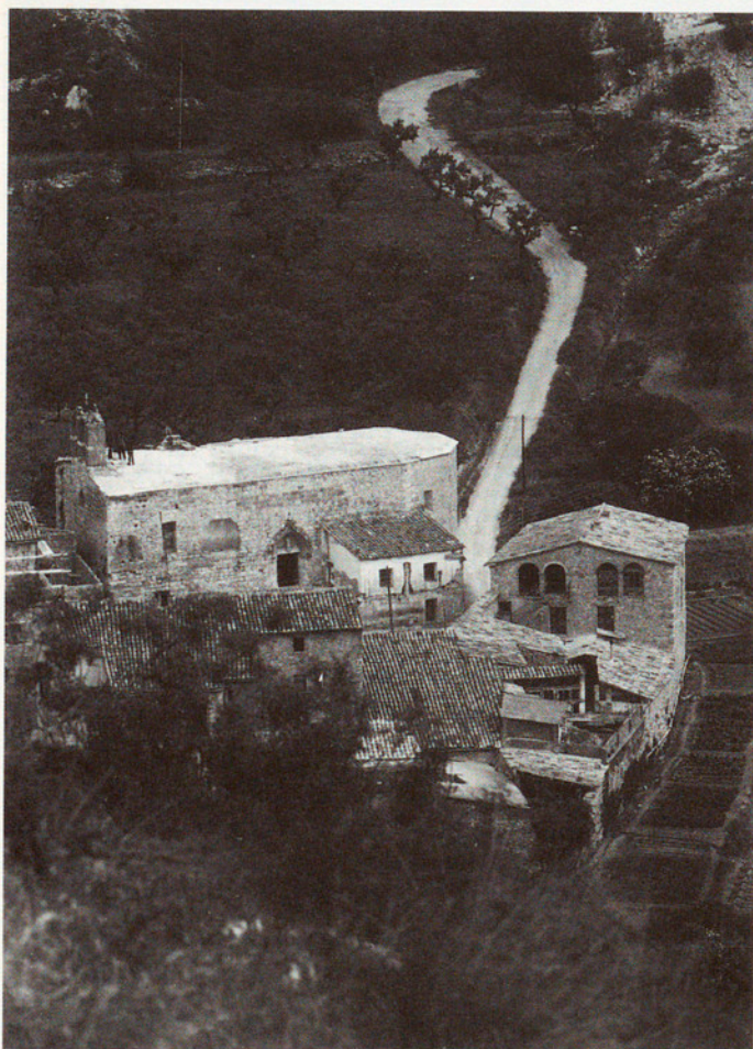
Panoràmica general del conjunt arquitectònic de Santa Càndia d'Orpí abans de la restauració definitiva. La fotografia reflecteix el moment en què s'estaven realitzant les obres de restauració i consolidació de la teulada.