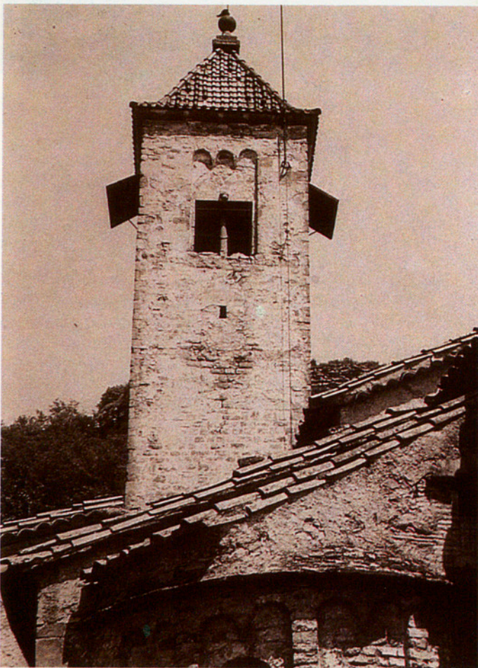
El campanar de Sant Vicenç de Malla data del segle XII; aquí es pot veure abans de les obres de restauració.