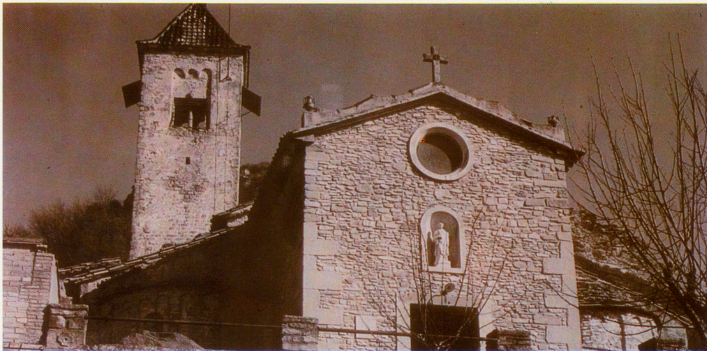
Encapçala la pàgina tot el conjunt arquitectònic abans de la intervenció. Al dessota hom hi pot veure la nova estructura d'accés al temple i el campanar romànic definitivament restaurat. L'estructura general de l'església és dels segles XVI i XVII.