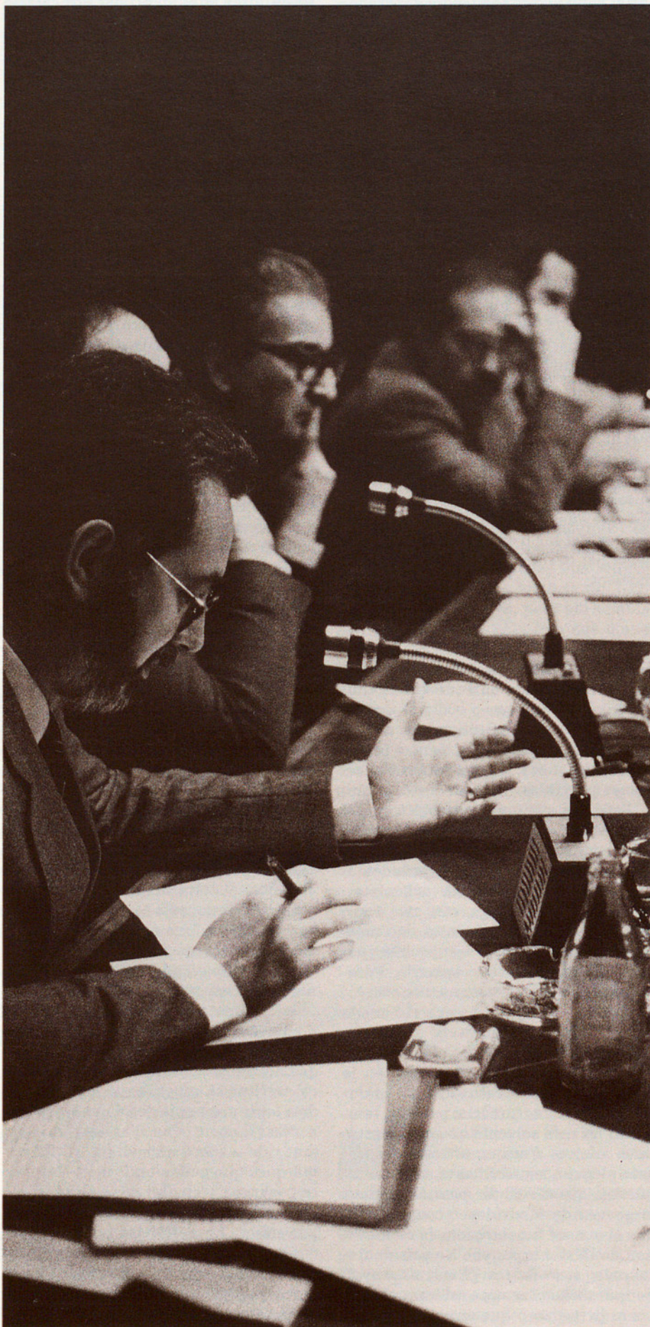
Panoràmica general de la taula rodona celebrada al Saló de Mapes del Palau de la Generalitat.

CARLES CARRERAS: Quines serien des d'ara mateix les passes adequades? Què cal fer? Bé, primer que res he de dir que jo no em sento convocat a respondre aquesta pregunta perquè no sóc un polític i no ho vull ésser. En una enquesta que vàrem fer a tots els caps de llista en les eleccions a l'últim Parlament de Catalunya els vàrem preguntar moltes qüestions entorn d'aquest tema de la divisió territorial; excepte el senyor Eduard Bueno de Coalició Popular i el senyor Heribert Barre- ra d'Esquerra Republicana, tots van dir que la qüestió territorial seria priorità- ria a la nova legislatura. Per tant, si hom sap llegir i entendre, el que cal fer per ser coherents amb el que deien du- rant la campanya és que s'hi posin a treballar.