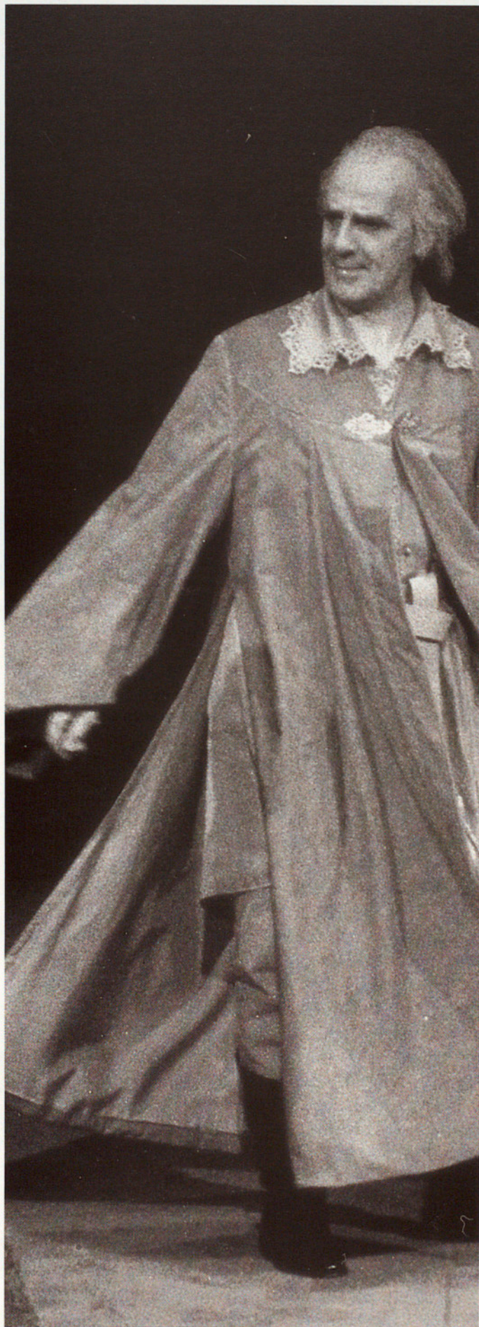
King Lear, Igmarr Bergman.