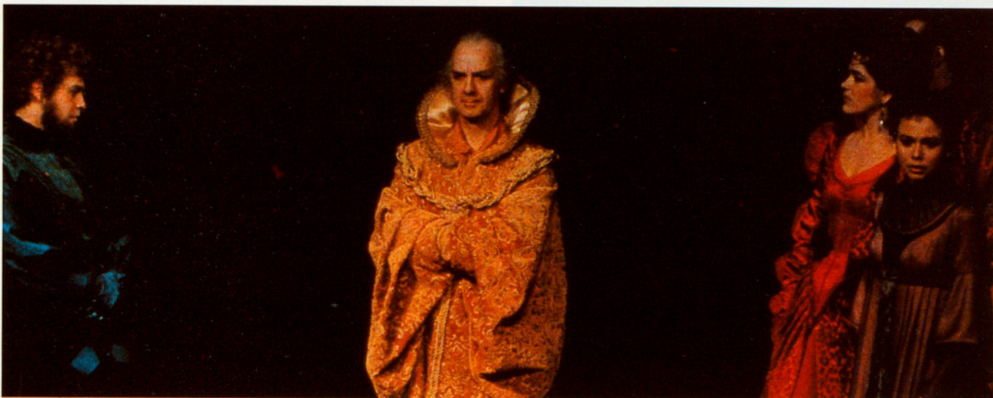
King Lear, Iqmar Bergman.

ment inútil, o allò que els francesos defineixen com un coup d'épée dans l'eau . I una altra cosa que no podem oblidar: si bé pel que sembla tothom està d'acord que l'Institut del Teatre ha de tornar a ser competència de la Generalitat —i quan això passi, veurem com s'integra dintre de l'estructura teatral pública, en relació, per exemple, al Centre Dramàtic o al possible Teatre Nacional—, el cert és que l'Institut del Teatre encara depèn d'una corporació d'àmbit provincial, cosa que limita absolutament el seu camp d'acció i dificulta la seva projecció nacional, tot i ser, de fet, l'escola de teatre de Catalunya. Així doncs, s'entén que Graells pensi que «tot i la urgència d'aquest debat nacional sobre el teatre, em sembla que no l'ha d'organitzar només l'Institut; no podem oblidar que l'Institut encara pertany a una corporació determinada i amb un color polític determinat, i aquests problemes, el país encara no els ha superat, i sí, en canvi, l'Institut. Vull dir —afegeix— que, en tot cas, i de cara a aquest futur debat, l'Institut pot contribuir-hi mitjançant aquest Congrés Internacional en el sentit