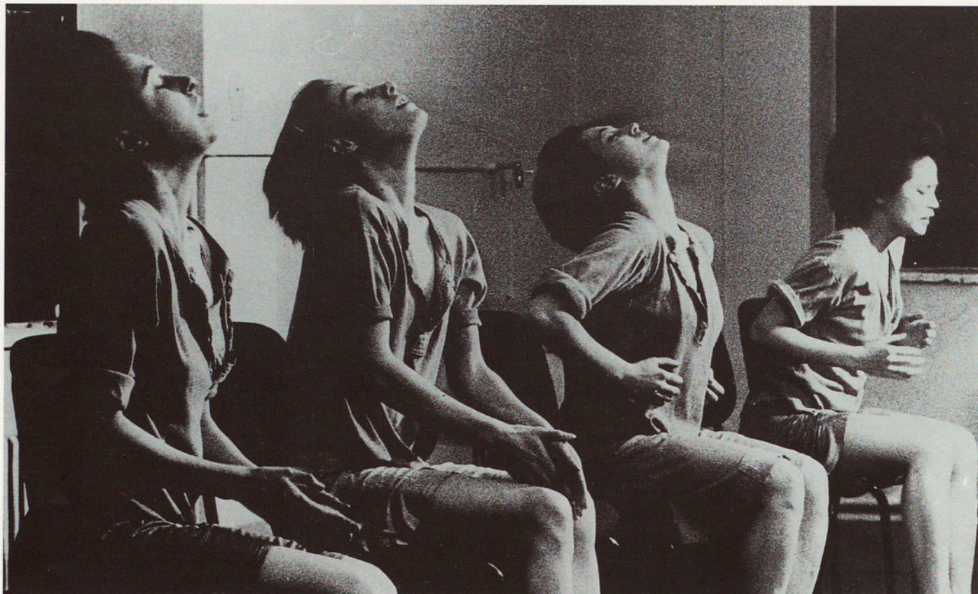
Un moment de la representació de l'obra «Rosas danst Rosas», amb coreografia de Anne Teresa Koersmaeker i música de Thierry de Mey.

la glòria del nostre teatre, va proposar que s'atorgués la subvenció demanada mitjançant la creació, en aquella entitat, d'uns cursos de declamació catalana».