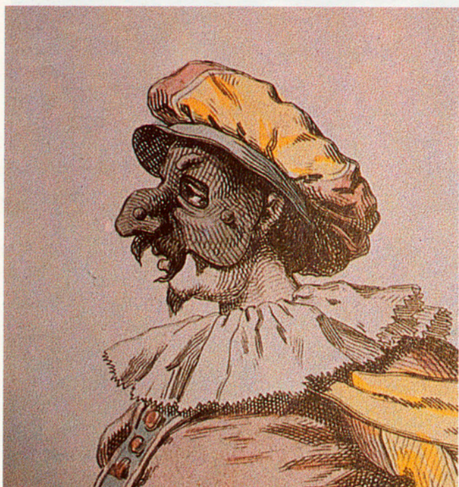
Aquarel·la d'un «Pulcinella» (1860).