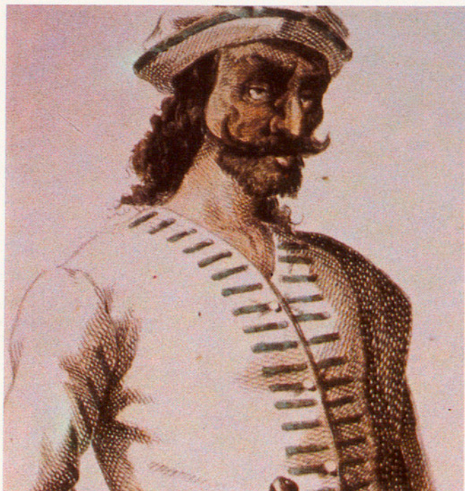
Una aquarel·la del 1860 que il·lustra el personatge Brighella.