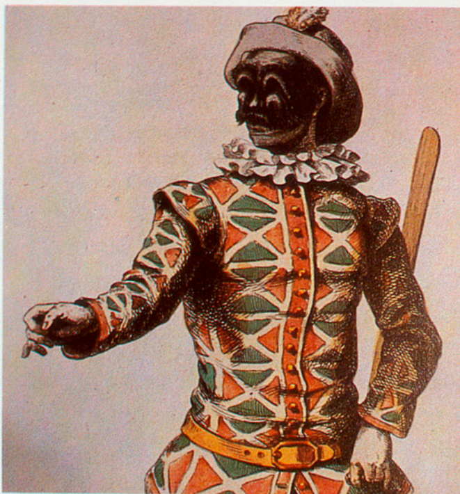
El celeberrim «Arlecchino» (1860).

partia el Petit Bourbon amb els actors de la commedia dell'arte . Després, des de 1660, seguiren compartint el Palais Royal i, finalment, el mateix any que es creà la Comédie Française (1680), els italians adquiriren l'antic Hôtel de Bourgogne que canvià al nom pel de Théâtre Italien, mentre que la companyia que hi actuava s'anomenava Comédie Italienne.