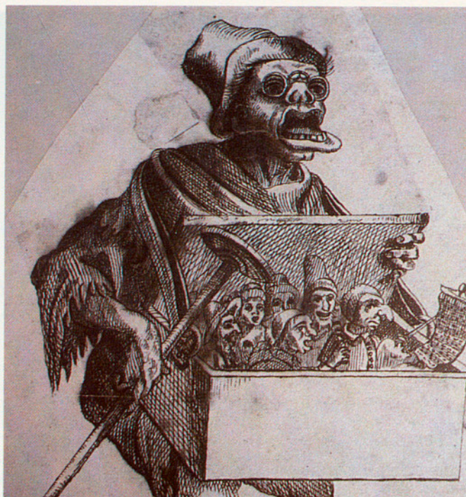
El «burattinaio» (s. XVII).