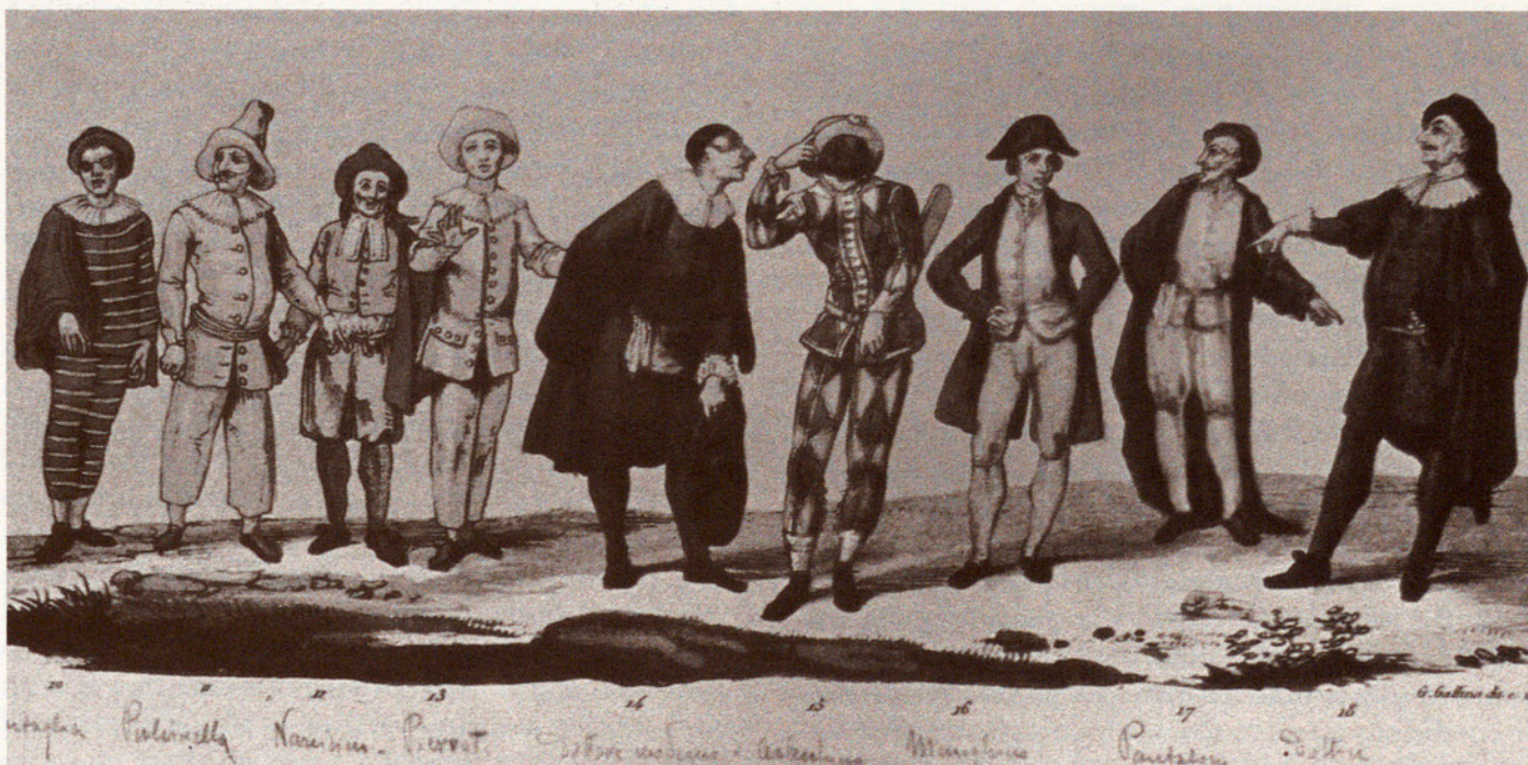
Seqüència de diferents màscares italianes. S. XIX.

Durant tota la primera meitat del XVII, nombroses companyies italianes actuaven a París llargues temporades. Sabem, per exemple, que el 1658 Molière com-