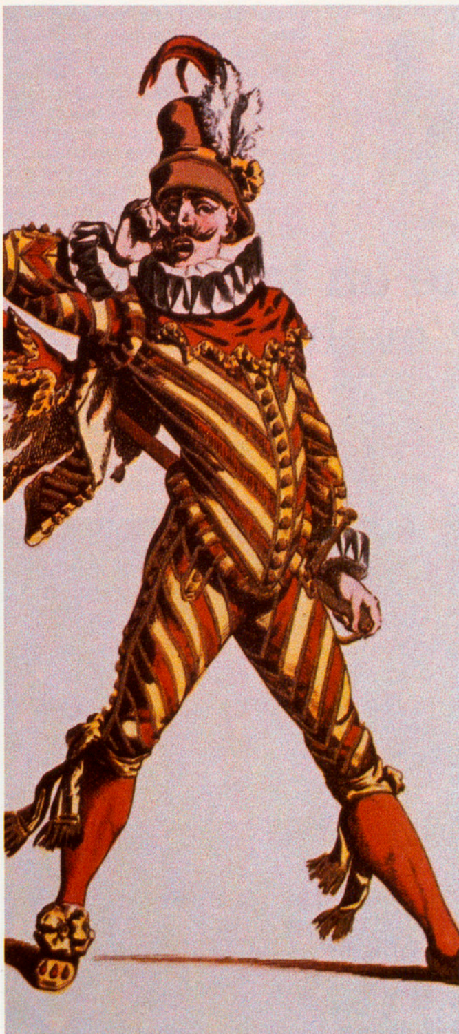
El capità Spaventa (1860).

la commedia dell'arte no és tampoc un tipus, en el sentit de personatges definits per un o pocs trets psicològics i morals dominats que es presenten com a símbols d'algun aspecte de la natura humana. Com explica Allardyce Nicoll en el cèlebre assaig The World of Harlequin (1963), «allò que la commedia dell'arte descobrí fou una cosa absolutament nova. En ella, una persona individual, per exemple, Pantalone, conserva el nom, el vestit i les característiques bàsiques en obres successives, però se'l fa aparèixer en