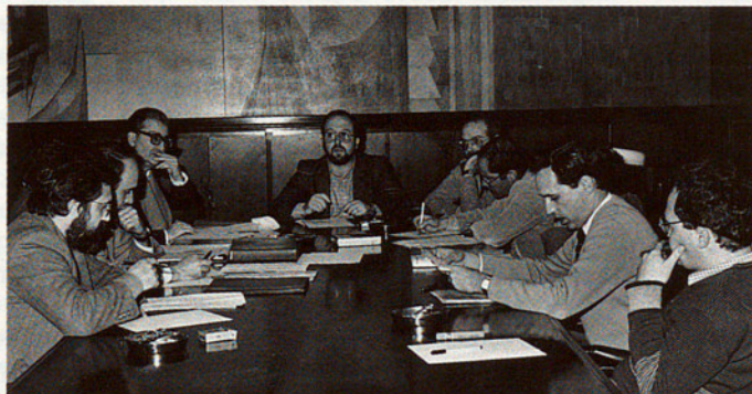
Panorama general de la taula rodona celebrada al Palau de la Generalitat.