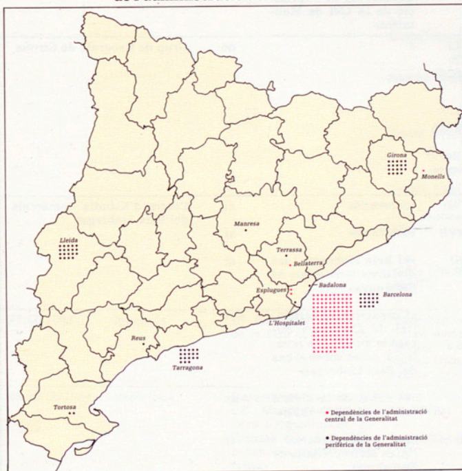
MAPA I: Localització territorial de les dependències de l'administració de la Generalitat.