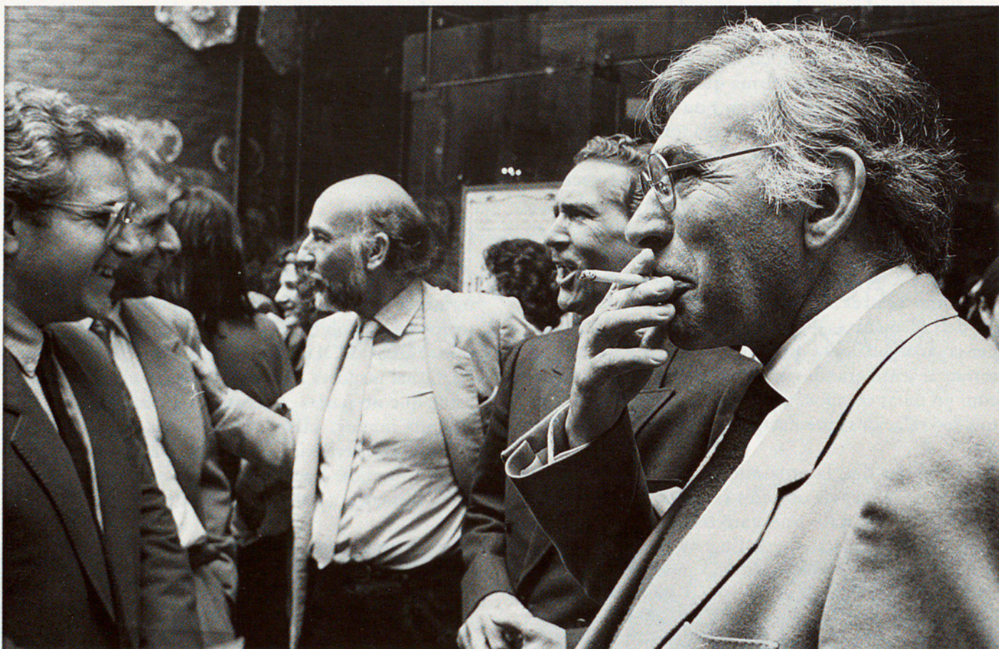
Adolfo Marsillach: humor i sarcasme.

formalismes que l'empresonaven. «Cada actor és un mim i és en el seu cos on s'organitza el joc constant de les impressions i les expressions. Però, existeix una diferència entre la pantomima i el mim, entre la paraula reemplaçada pel gest i el gest que s'expressa sense la paraula, en un territori on ella no hi té lloc. Es tracta de dos silencis de qualitat diferent».