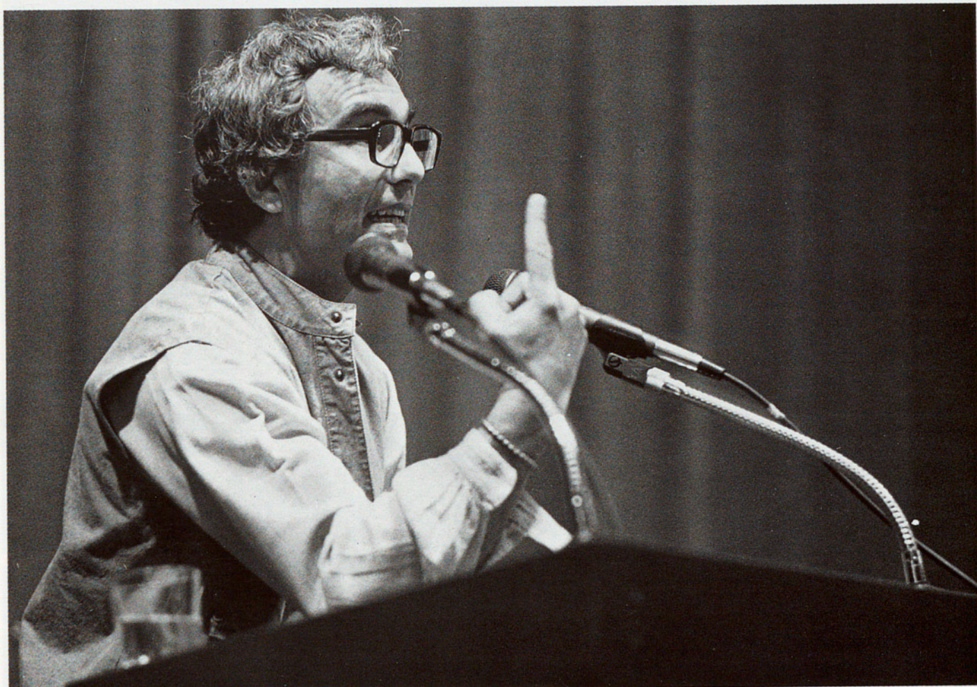
Eugenio Barba: un discurs improvisat.