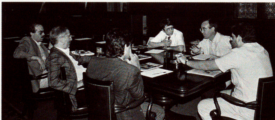
DAMUNT LA TAULA, TOTS ELS DUBTES SOBRE LA NECESSITAT DELS "ANYS INTERNACIONALS"

PUIG. Tot el fenomen juvenil dels joves dels anys seixanta i setanta va venir perquè després de la guerra vam trobar-nos amb quatre peles per poder anar a sentir l'Elvis i companyia i podies fer unes vacances, perquè podies tenir una feina que t'ho permetia i et podies muntar la vida més sol. D'aquí va sortir tota la gent que estem intervenint aquí, hem crescut, ens ho hem muntat des d'aquesta època i ara tornem a estar en una altra època en què la gent no té ni dos duros a la butxaca i tornariem a començar una altra vegada el debat, perquè és el que hem començat dient. Trobo que està molt bé com has acabat tu, amb aquesta placidesa. Acabar un debat parlant de placidesa és agradabilíssim...◀