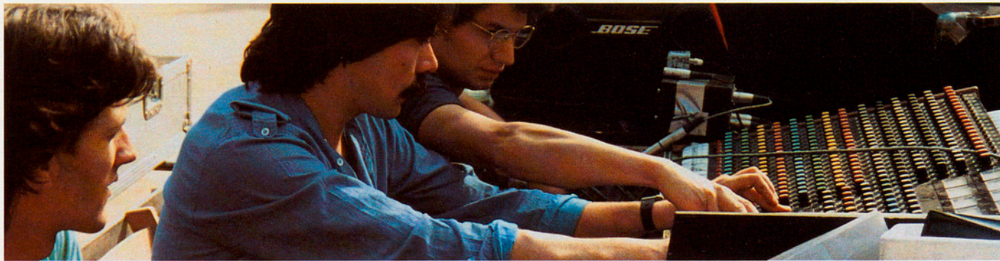
QUINA TECLA CAL TOCAR PER ALBIRAR EL FUTUR?

— Desconfiar del que hem fet. De tot el que hem fet fins ara, que no vol dir renunciar-hi ni menysprear-ho. En tot cas, proposar una anàlisi crítica i afirmativa que usi com a eina la raó i la