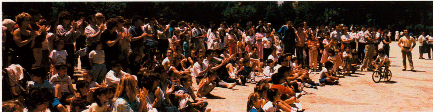
ELS ESPECTACLES A L'AIRE LLIURE HAN REVIFAT ELS ÀMBITS URBANS

No sóc dels que pensen que estem en crisi total. Us ben asseguro que no tinc la sensació de crisi. Crec que als seixanta o setanta teníem uns maldecaps que vàrem intentar resoldre. Ara en tenim uns altres que, ben mirat, compten més perquè són més gruixuts a causa de