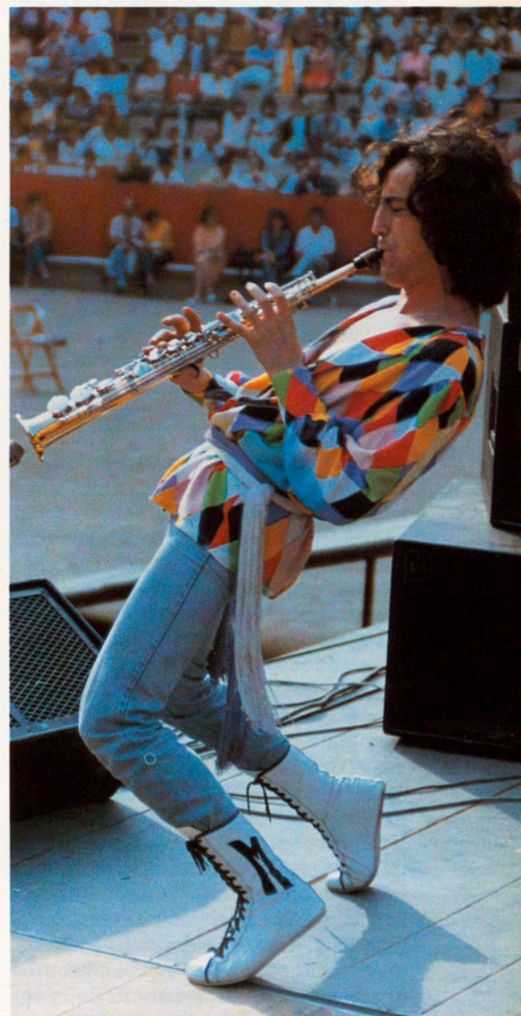
LA MÚSICA ÉS IMPORTANT PER ALS JOVES

La ciutat burgesa industrial estava molt estratificada. Cada sector tenia els