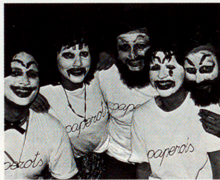
LES NOVES FORMES D'EXPRESSIONS ES REVELEN COM UNA NECESSITAT

Avui es parla molt de la societat civil en la qual hem viscut. Era una societat sorgida de la civilització burgesa que propugnava el pluralisme i les virtuts cíviques que facilitaven el fet d'enriquir-se i d'autocontemplar-se. I també feien possible viure mitjanament bé en el món amb els draps calents de la tolerància, l'individualisme, la privadesa, la llibertat contractual, el respecte a la llibertat privada i un respecte diferencial cap a les classes dominants. La societat civil no era gran cosa com a mo-