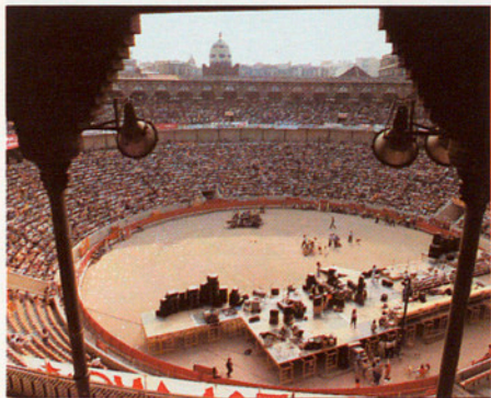
A LA SENSACIÓ DE COMUNITAT, HI HAN CONTRIBUTIT MOLT MÉS ELS ESPECTACLES DE MASSES QUE NO PAS ELS TRADICIONALS

ciutats ens diu que hi ha un cert desori entre pintors, cineastes, pensadors, líders juvenils, polítics i professionals de la cultura. Ningú no sap gaire què fer, per on tirar, i han perdut, tots plegats, aquella seguretat que els donava l'art abstracte, el cinema d'art i assaig, la ciència, l'associacionisme com a entitat, l'estructuració d'una política cultural nova... En el fons, ningú no ho amaga, ens hem trobat que la terra ferma de les ideologies que trepitjàvem ha resultat que no tenia sorra i que, en alguns casos, era aigua. Tant que hi havíem cregut! Tant que hi havíem exposat! Fins i tot les ciències més incontaminables i fora de tota sospita, com ara l'economia i la sociologia, fan aigües i no ens serveixen tal com pensàvem. La universitat és un pàrquing de ciutadans que descansen en el si d'un dinosaure que sap, però que ja no hem partit del seu saber. I n'hi ha molts que busquen