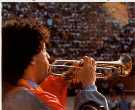
A QUI O A QUÈ ES GIREN D'ESQUENA ELS JOVES?

Com genets apocalíptics d'una nova crisi urbana que —si no ens volem trobar amb una nova assignatura pendent— cal parar, intervenint-hi, l'atur i el treball submergit, els barris desassistits, els joves sense horitzons, la comunicació en soledat, les significacions culturals diluïdes en el transnacional, l'escepticisme democràtic transformat en desesperació política, la societat civil de rebaixes..., demanen un plantejament racional i nou. Perquè la crisi urbana és nova. I els problemes i les il·lusions dels seus joves habitants són diferents i nous. I noves i decidides han de ser les intervencions si encara volem, malgrat tot, facilitar als joves la