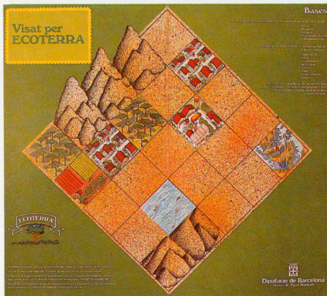
TAULER QUE REPRESENTA EL MAPA D'ECOTERRA

De fitxes, n'hi ha deu de cada, excepte d'embassa-