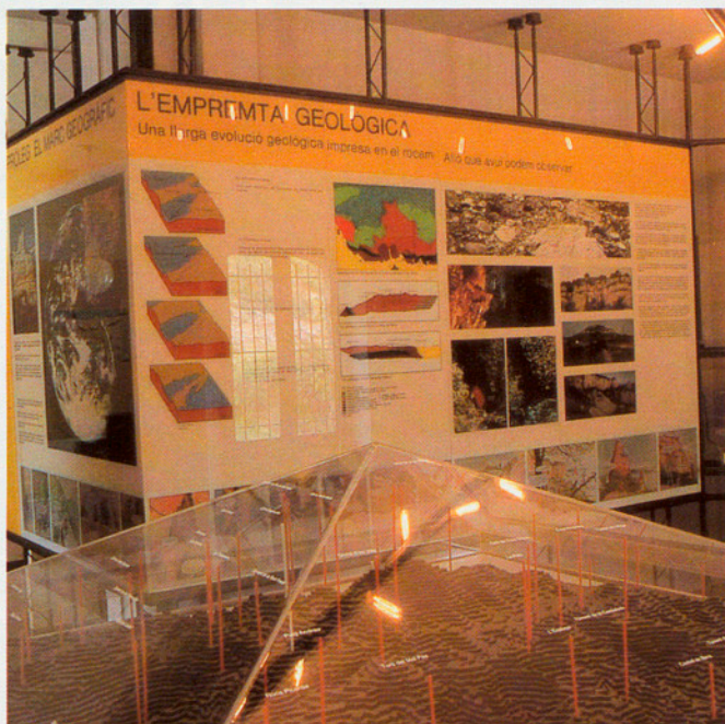
EXPOSICIO INFORMATIVA SOBRE EL PARC QUE HI HA A L'INTERIOR DEL CENTRE D'INTERPRETACIÓ DEL COLL D'ESTENALLES. PARC NATURAL DE SANT LLORENÇ DEL MUNT I LA SERRA DE L'OBAC