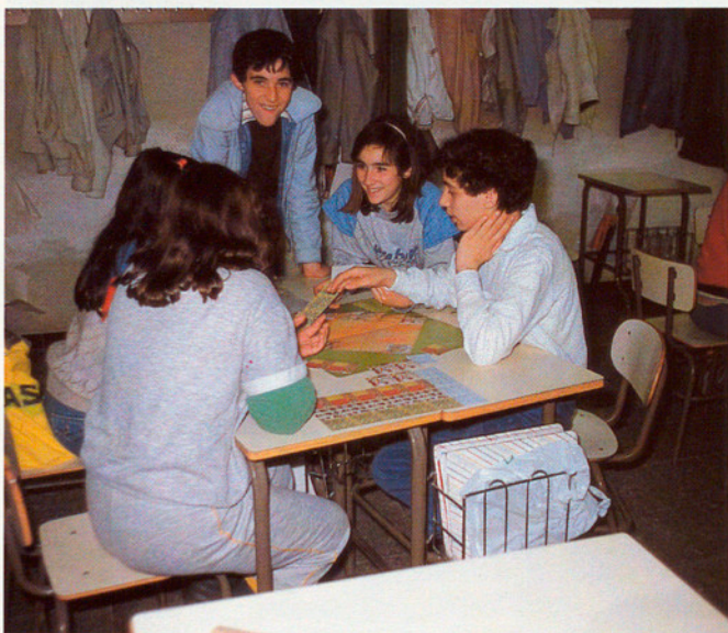
JUGAR A ECOTERRA ÉS PENSAR COM ORDENAR UN PAÍS IMAGINARI

Hem constatat la bona acceptació que ha tingut entre els escolars. En una darrera enquesta, contestada per 700 escolars, davant la pregunta "T'agrada pensar com ordenar un país imaginari?"