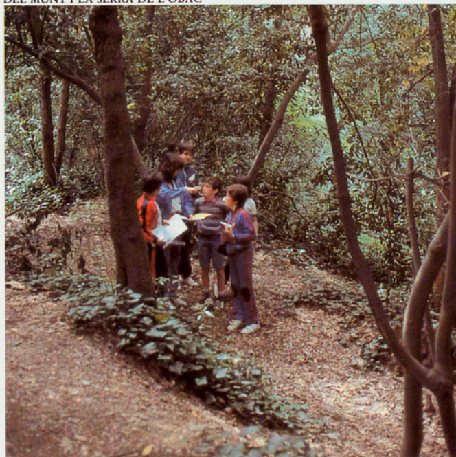
L'ESTUDI DE LA NATURA ÉS UNA DE LES ACTIVITATS QUE ES FAN AL PARC (MONTSENY)

els recorda els coneixements adquirits a la fase del programa i els situa en la realitat que els nois estan observant.