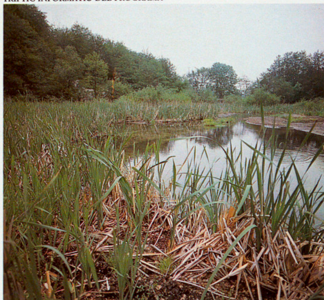
DETALL DE L'ESTANYOL DE SANTA FE COLONITZAT PER LA BOGA. (PARC NATURAL DEL MONTSENY)