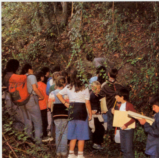
OBSERVAR I INVESTIGAR AJUDA A CONÈIXER MILLOR EL MEDI NATURAL (LES HEURES)

Des del curs 1982-83 han participat en el programa 17.464 escolars de 6è nivell d'EGB distribuïts en vint-i-nou municipis de l'àrea metropolitana.