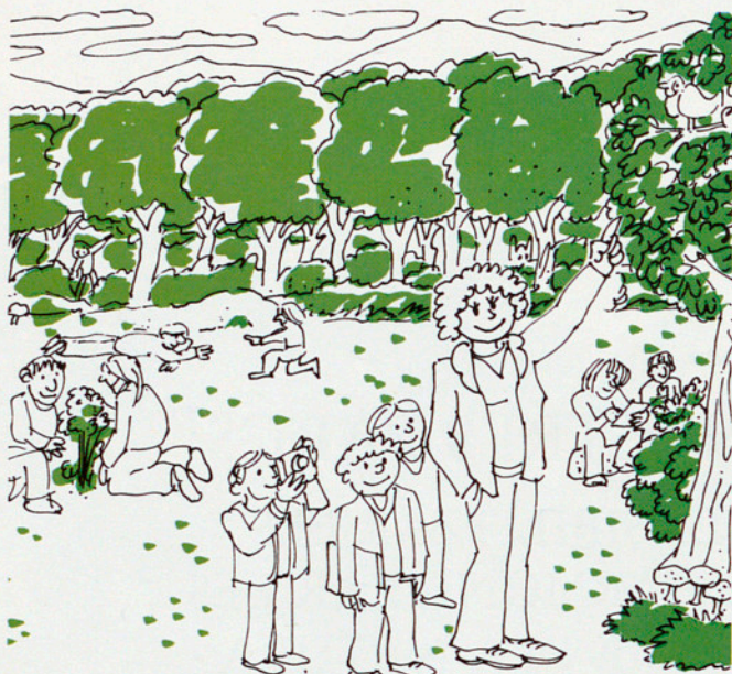
TRÍPTIC INFORMATIU DEL PROGRAMA