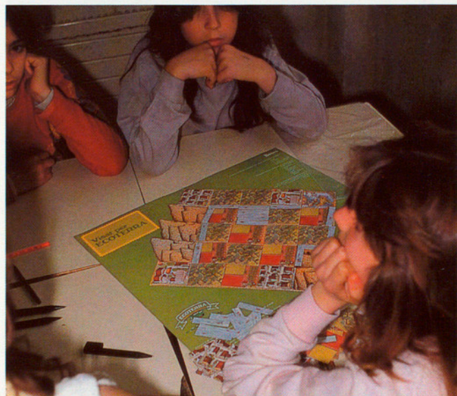
ELS MODELS REALITZATS ES DISCUTEIXEN AMB TOTA LA CLASSE

L'activitat consisteix en la visita d'un dels equipaments del parc natural i la realització posterior d'un itinerari a fi de descobrir, observar i prendre contacte