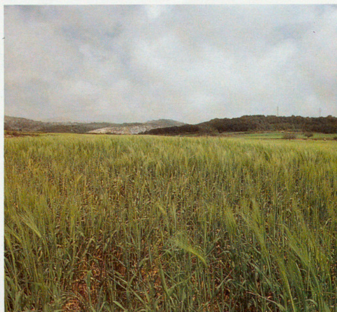
ACTIVITATS AGRÀRIES EN UN CAMP DE CONREU