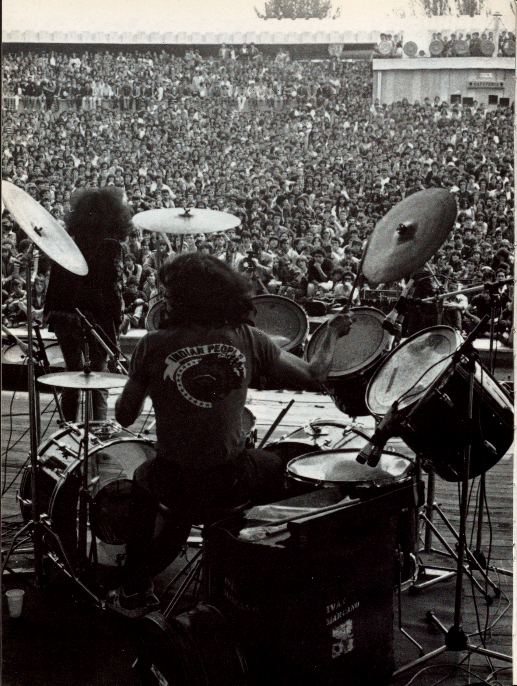
LES CAMPANYES DE MÚSICA I ESCENA A L'ABAST HAN ASSOLIT UNA ACCEPTACIÓ FORÇA CONSIDERABLE D'UN A L'ALTRE