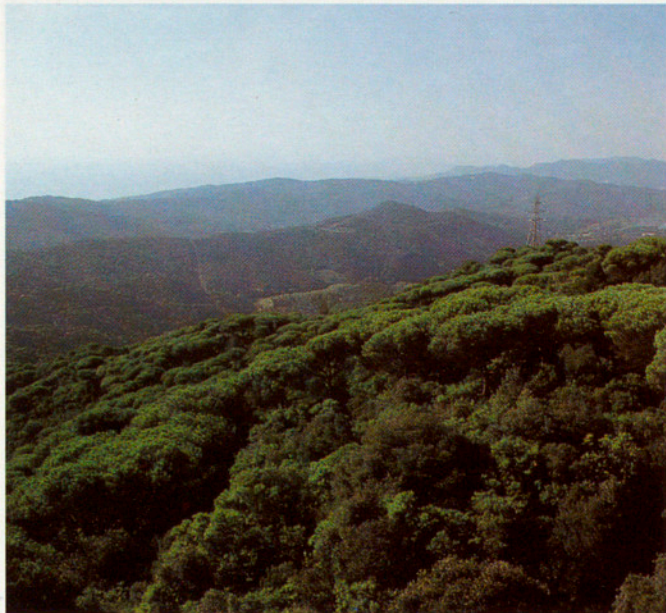
EL BOSC A CASA NOSTRA, (EL CORREDOR)

Acabada la projecció s'estableix un diàleg amb els alumnes a fi de repassar les idees bàsiques que s'han tractat a l'àudio-visual i que hauran d'utilitzar per jugar a "visat per a ecoterra".