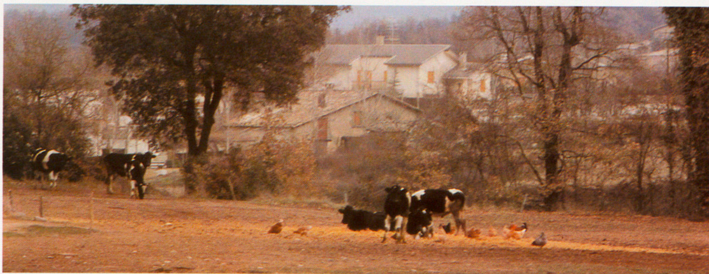
EL SECTOR LÀCTIC TÉ CADA VEGADA MÉS IMPORTÀNCIA AL SI D'UNA SOCIETAT DESENVOLUPADA

està relacionat amb l'alimentació del bestiar. Per una part, els contractes de parceria limiten la producció lliure de farratges per al bestiar propi, per l'altre, cal preveure l'emmagatzemament del farratge per tal d'ajustar el ritme de producció —cíclic— al de consum —permanent—. L'entrada a la CEE constituirà un nou reptre davant la forta competència i l'augment del control sanitari que s'apropen. El problema del sanejament és, per això, un dels més urgents i grans amb què s'enfronta la ramaderia bovina a Osona, a Catalunya i a Espanya.