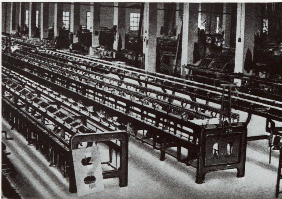
TALLER DE FABRICACIÓ DE CONTÍNUES DE FILAR DE LA FÀBRICA SERRA DE MANLLEU

La Primera Guerra Mundial provocà una gran demanda de productes tèxtils, dels quals Osona continuava essent un dels principals nuclis productors. Les nombroses colònies tèxtils, creades entre la fi del XIX i el principi del segle actual, es consolidaren a Roda, Gurb (Malards), Manlleu, Torelló, Sant Vicenç, les Masies de Voltregà, Orís, etcètera; amb un règim tancat i paternalista, un nivell salarial baix, una classe treballadora submissa i poc conflictiva, condicionada per un treball i una vivenda estables i, en comptades excepcions, beneficiària d'unes millores