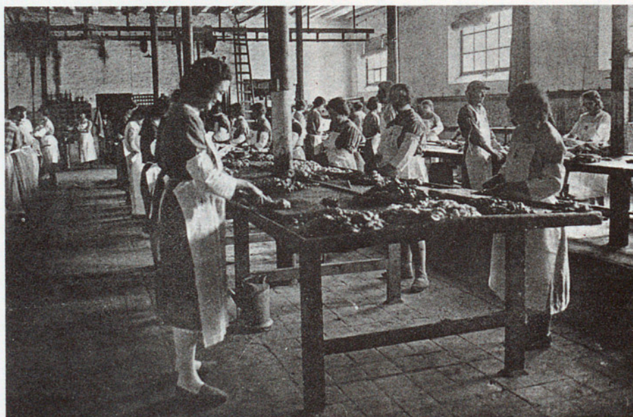
DE DALT A BAIX: EL MERCAT DE VIC, PAGÈS AMB UNA GARBA I FÀBRICA D'EMBOTTITS (LES DONES HI OCUPAVEN MOLTS LLOCS DE TREBALL)