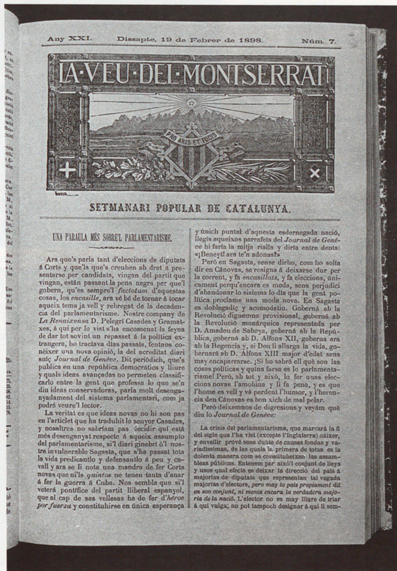
«LA VEU DEL MONTSERRAT», PORTAVEU DEL CATALANISME CONSERVADOR

La coexistència momentània de dos móns econòmics diferenciats a l'interior d'Osona —el dels nuclis industrials i el dels nuclis desindustrialitzats (Vic, Taradell, Centelles, etcètera)—