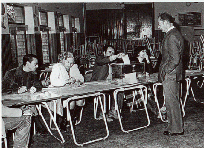
AMB LES PRIMERES ELECCIONS S'ACABAVA EL PERÍODE DE LA DICTADURA.