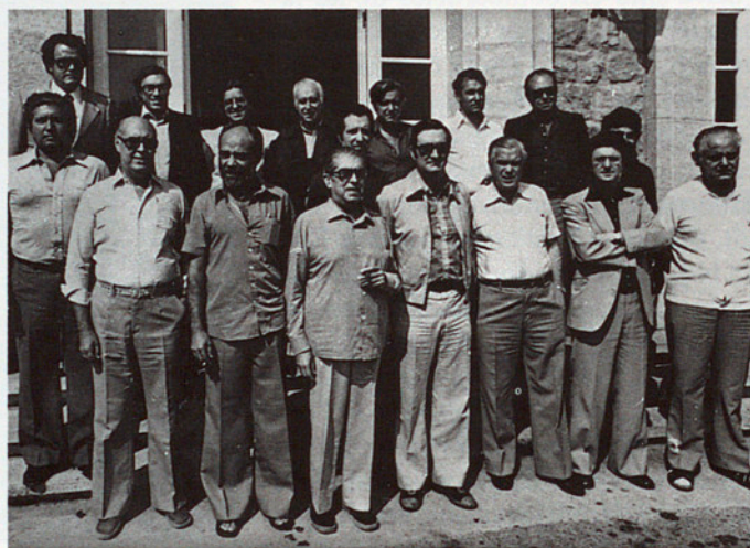
ELS PARLAMENTARIS AL PARADOR DE SAU (MASIES DE RODA)

concentració a Vic, Granollers i pobles del voltant, un bon nombre de persones. Vic va quedar assetjat, i la plaça, ocupada per la Guàrdia Civil i els "grisos" —policia governativa d'ordre públic.