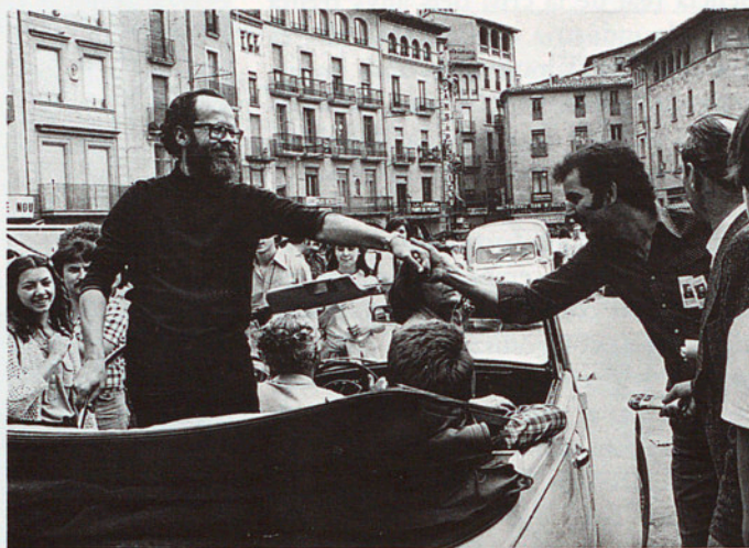
XIRINACS, EN PLENA CAMPANYA ELECTORAL PER A LES ELECCIONS DE 1977.