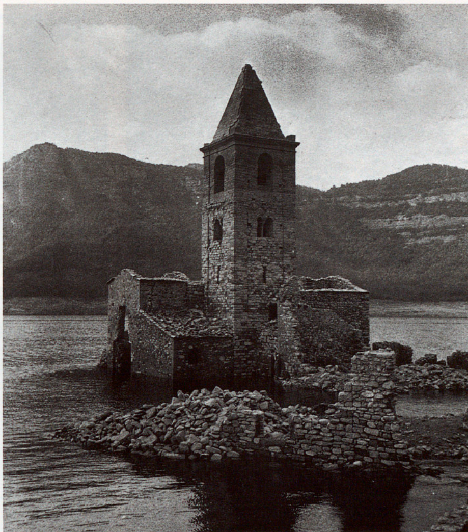
LA IMATGE D'UN PASSAT REMOT ENFRONT DE LES NOVES NECESSITATS D'ENERGIA: EL PANTÀ DE SAU

pèrdua del poder adquisitiu de la població, el racionament d'aliments, el mercat negre o l'"estraperlo", acompanyaven la profunda repressió de què fou objecte tot signe d'identitat nacional catalana o qualsevol participació política o administrativa durant el període republicà. El nombre d'afusellats per motius polítics a Osona, segons J. M. Solé i Sabaté, és de 158 persones al Camp de la Bóta de Barcelona, que representen el 2,1 per mil de la població —un índex superior al total català, que gira al voltant de l'1,2 per mil. Durant el franquisme, a Osona les personalitats polítiques foren reclutades entre persones considerades "d'ordre" i, fins i tot, antics col·laboradors de la Lliga o, també, de la Dictadura d'en Primo de Rivera. La incidència del nacional-catolicisme fou molt forta, en una comarca on l'Església tenia tant de poder, en la persona del bisbe Perelló, que governava la Seu vigatana en aquell moment. Molts dels actes públics del franquisme van tenir a Osona un protagonisme religiós molt gran: les missions de 1945,