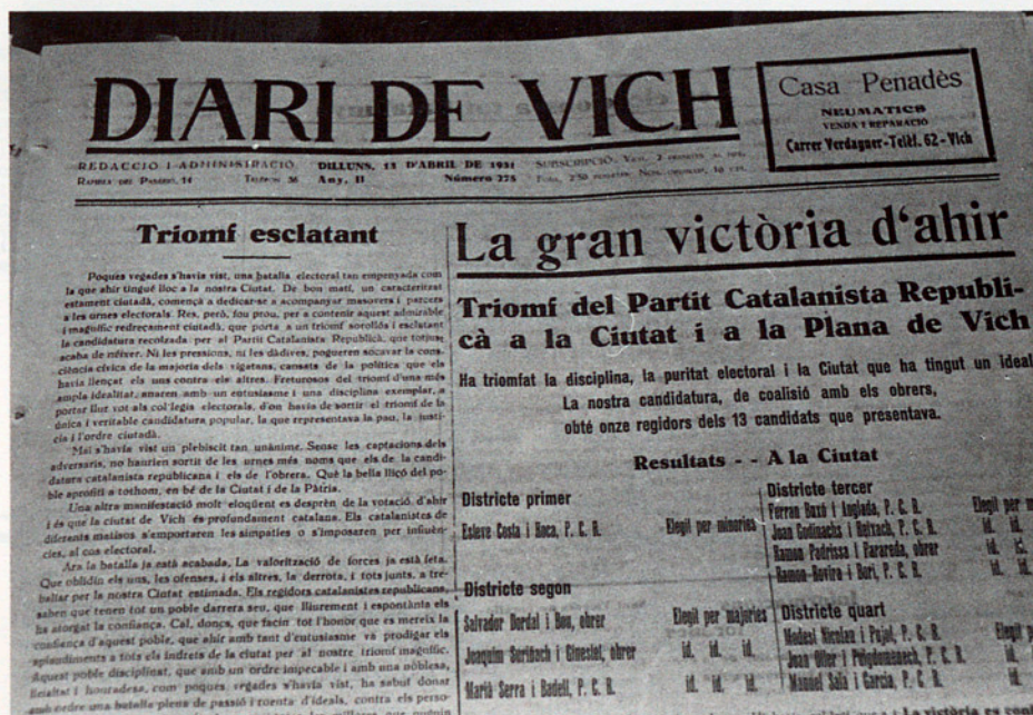
LES IMATGES PARLEN TOTES SOLES

L'anàlisi demogràfica és prou eloqüent. Després del creixement de la població durant el primer terç de segle, ve la davallada provocada per la guerra civil i la recuperació posterior, sobretot des dels anys cinquanta, que s'incrementa notablement a partir dels seixanta com es pot veure al quadre número 1.