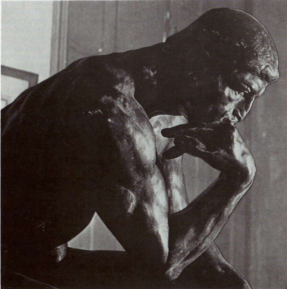
QUÈ PENSEN ELS HOMES SOBRE LA PLANIFICACIÓ FAMILIAR? «EL PENSADOR», OBRA DE RODIN (PARÍS, 1886)