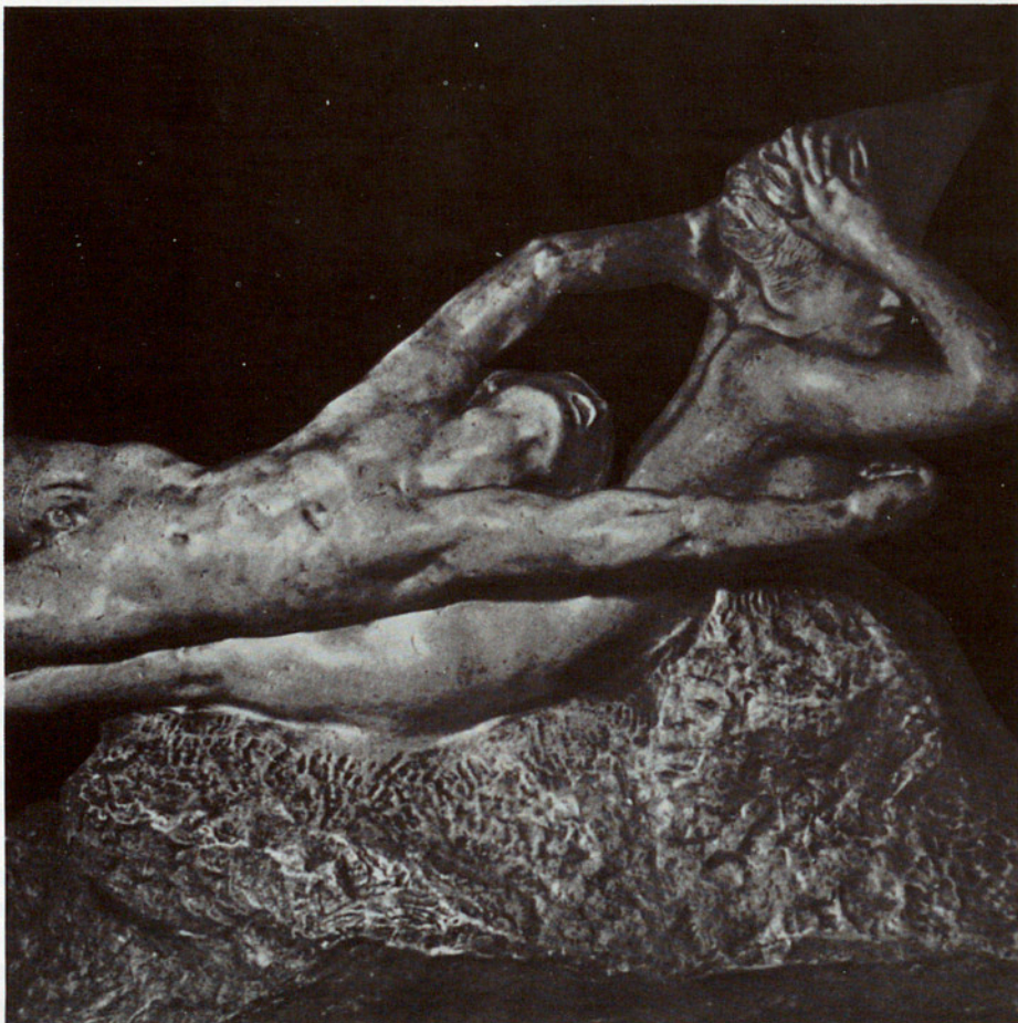
FINS ARA L'HOME HA VIST CONDICIONADA LA SEVA ACTUACIÓ DINS LA PARELLA PER FACTORS SOCIALS CASTRADORS DE LA SEVA PERSONALITAT. «FUGIT AMOR», OBRA DE RODIN (PARÍS, 1886)

atorguem el poder a l'home en les decisions importants de la família i del grup, li exigim en contrapartida que «sempre pugui», que sigui invulnerable, i això li crea una gran ansietat en la mesura que ha de respondre d'una manera o d'una altra a les expectatives explícites i implícites del paper que se li encomana, tant si ell l'ha triat com si no. Alhora, li neguem la possibilitat de mostrar les seves febleses de ser humà com les mostrem les dones.