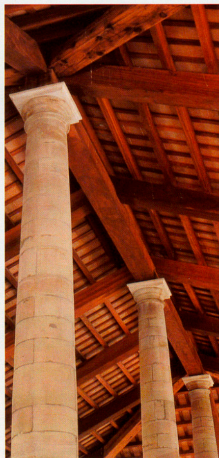
DIFERENTS ASPECTES DE L'ESTRUCTURA DE FUSTA A QUATRE VESSANTS DE LA PORXADA

remunta a l'any 944. Altres fonts documentals testimonien que tenia una funció de mercat: el 1040 se l'anomena granularios superiore . Encara més, entre els anys 1014 i 1043 hi ha referències més concretes: mercato e granularis i forum granularis .