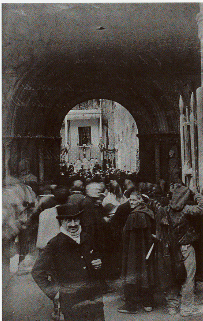
DETALL DE LA INDUMENTÀRIA EMPRADA PELS RIPOLLESOS EL DIA DE LA INAUGURACIÓ DE LES OBRES DE RECONSTRUCCIÓ, 21 DE MARÇ DE 1886