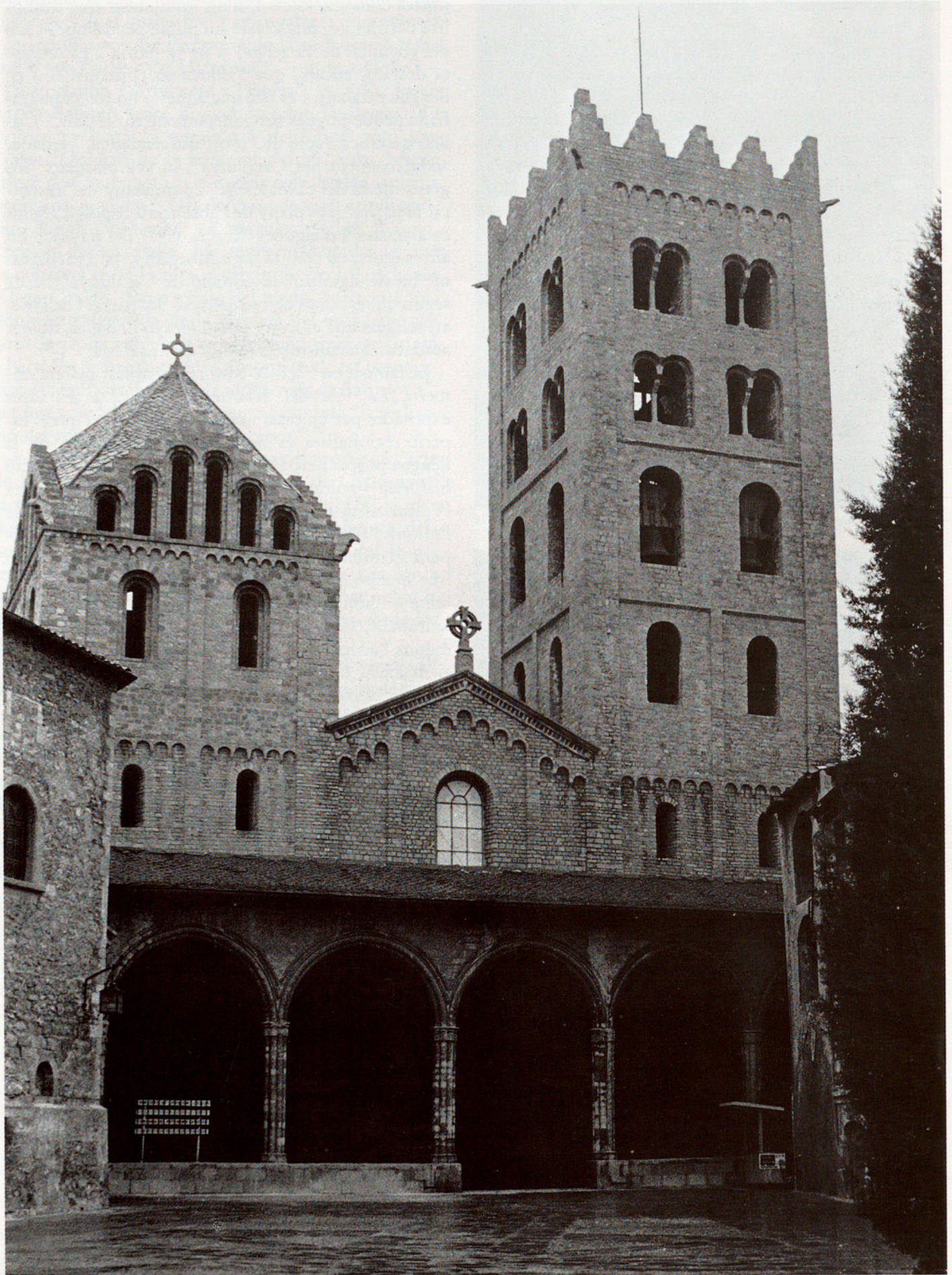
LA FAÇANA RESTAURADA DEL MONESTIR