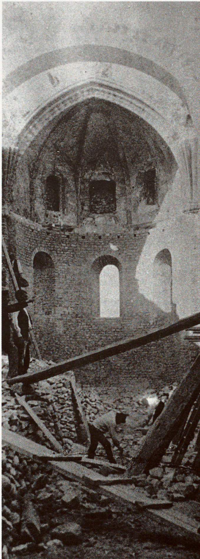
OBRES DE RESTAURACIÓ A L'INTERIOR DEL MONESTIR

“Tots saben lo que significa Ripoll en la historia de nostra nacionalitat (...) lo Santuari de Santa Maria de Ripoll no s'axecaria de sa ruina, sino