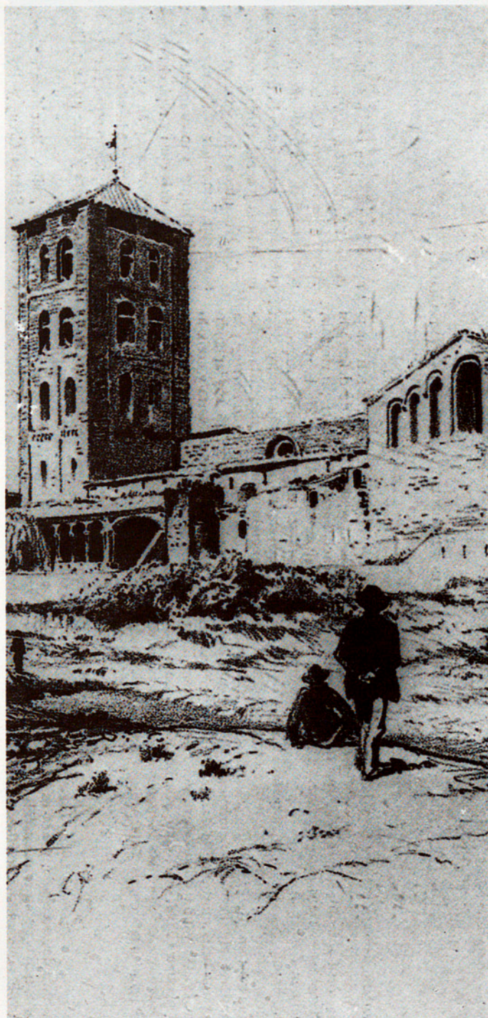
RUÏNES DEL MONESTIR. AQUAREL·LA DE SOLER I ROVIROSA (MUSEU FOLKLÒRIC. RIPOLL, 26 SETEMBRE 1881)