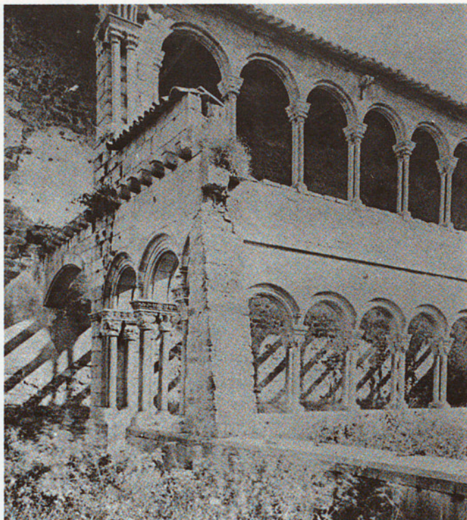
ELS CLAUSTRES EN RUÏNES DEL MONESTIR DE SANTA MARIA DE RIPOLL ELS ANYS 1881-1885

“Un Príncep de la Iglesia (...) ha dat la senyal de restauració del primer monument de la nació catalana, del sagrat bressol de la nostra independència, que en mal hora [sic] destroçaren las passions revolucionaries d'un sigle que somiejava ¡insensat! viure vida nova estroncant la sava vital dels pobles, trencant la cadena de la tradició (...) Catalunya alena encara; Catalunya sent remoure en sas entranyas un esperit indomable i sent aletejar (...) un ventijol precursor de millors dias (...) Las pedras del Santuari de Ripoll tornaran a axecarse com s'alsa (...) l'esperit català, y l'obra que anem a comensar (...) será demá com