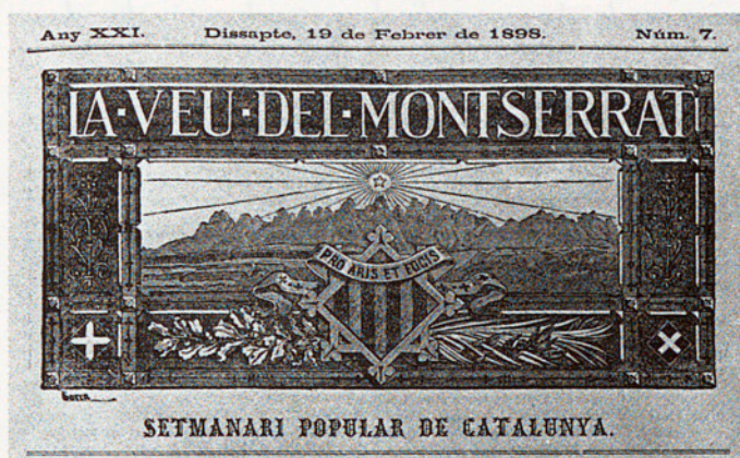
CAPÇALERA DE «LA VEU DE MONTSERRAT» QUE VA PARTICIPAR ACTIVAMENT EN LA CAMpanyA A FAVOR DE LA RESTAURACIÓ DEL MONESTIR

Segons Collell, el papa s'interessà vivament per la restauració de Ripoll i s'oferí a contribuir-hi personalment tot encapçalant la llista dels benefactors amb un donatiu important: un magnífic mosaic de la Verge per al nou retaule del temple restaurat. Tanmateix, no passà per alt al perspicaç canonge el recel amb què Lleó XIII considerava l'actuació catalanista de Collell i de Morgades. El pontífex li manifestà obertament els seus temors que els ideals que guiaven aquesta actuació fossin desvirtuats "y'l moviment [catalanista] des-