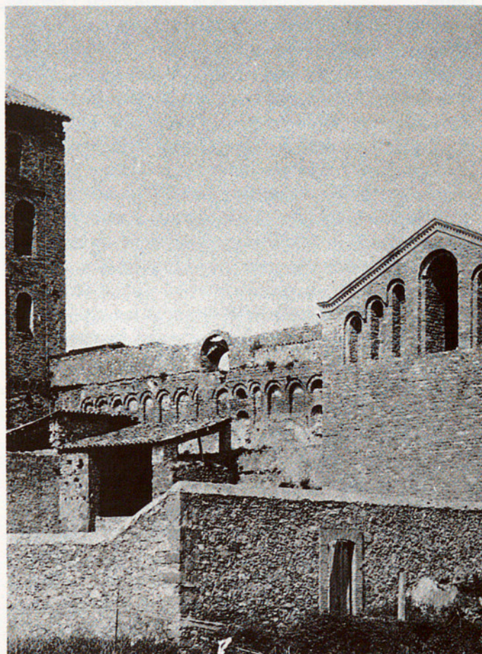
L'ABANS I EL DESPRÉS: OBRES DE RESTAURACIÓ DELS ABSIS DEL MONESTIR DE SANTA MARIA DE RIPOLL (1886)