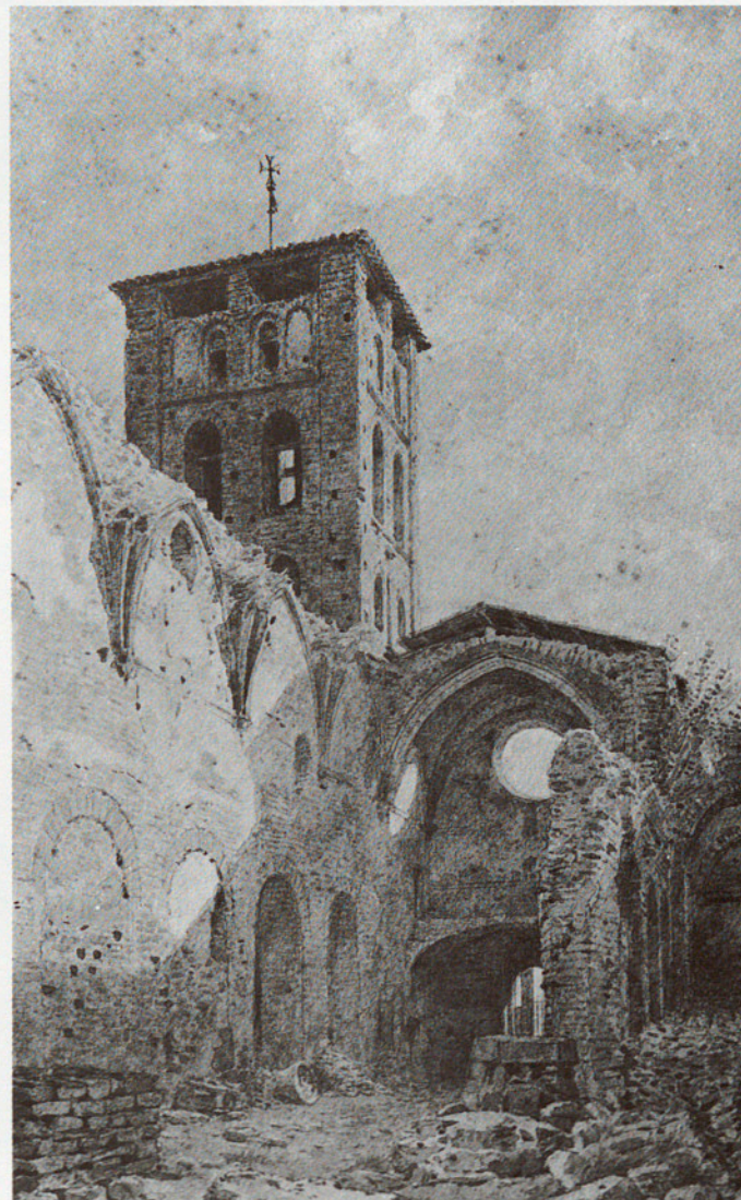
VISTA GENERAL DEL MONESTIR ABANS DE LA RESTAURACIÓ