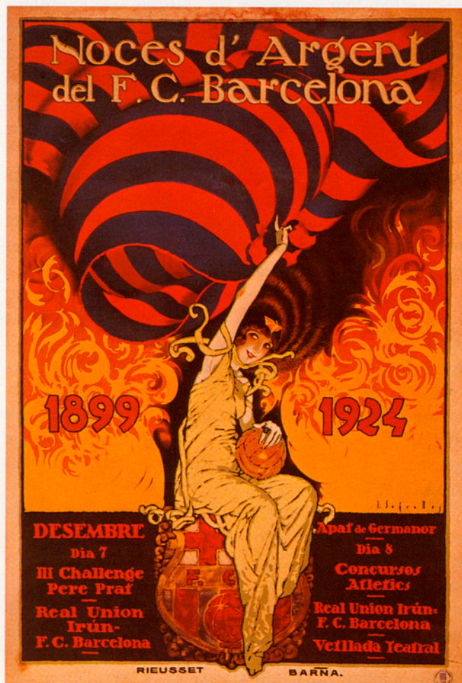
L'ANY 1924 SE CELEBRAREN LES NOCES D'ARGENT DEL F.C. BARCELONA

Entre els personatges més remarcables de la Barcino del segle II, els Minicius Natalis són els qui amb