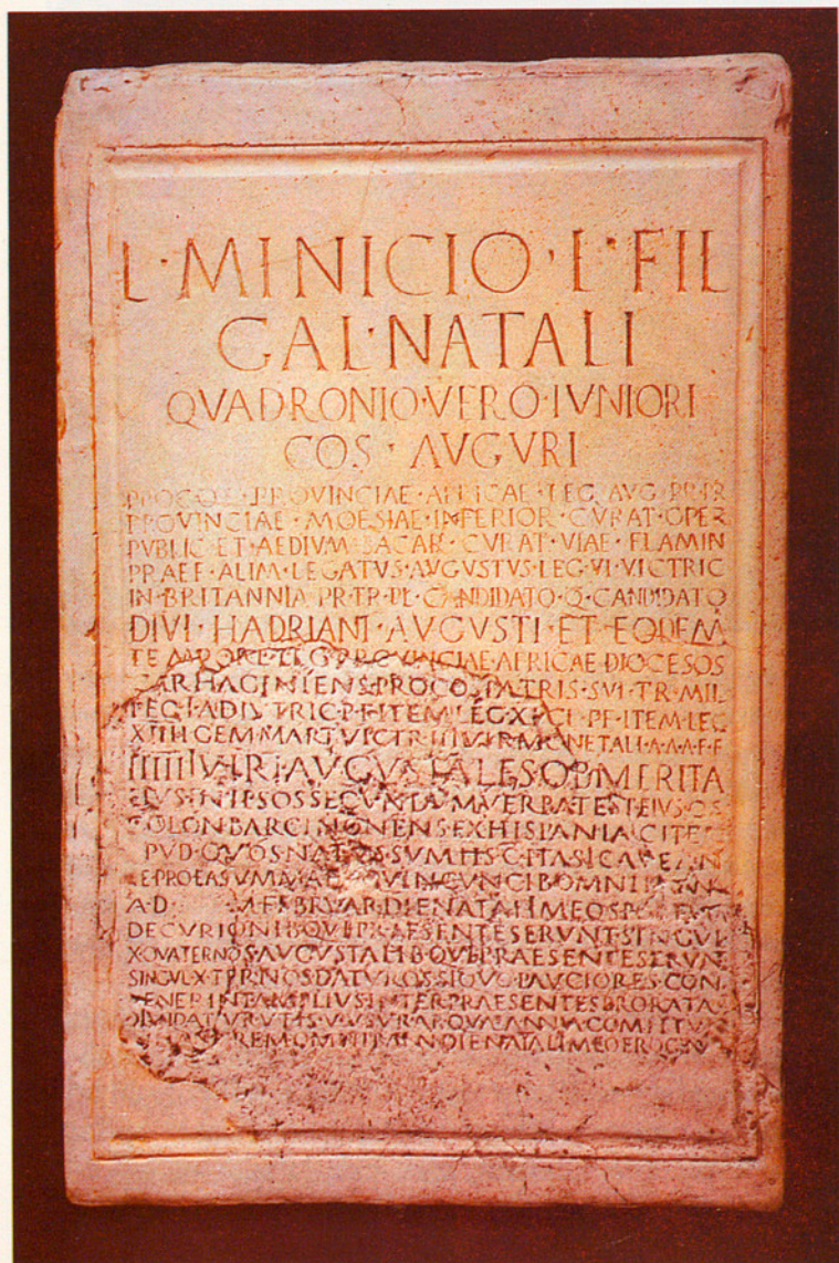
LA BARCELONA ESPORTIVA ES REMUNTA A L'ÈPOCA ROMANA.

B arcelona és una ciutat amb un historial esportiu i esperit olímpic que poques ciutats del món poden oferir. I compta, si més no, amb uns ciutadans que estimen l'esport i que han fet possible que la Ciutat Comtal, Cap i Casal de Catalunya, hagi estat bressol de la majoria de modalitats esportives que avui es practiquen arreu de l'Estat espanyol. A final del segle passat aquesta vocació esportiva de Barcelona es va manifestar amb la fundació d'entitats esportives sorgides de la iniciativa popular, entre elles el Futbol Club Barcelona, un club que, al marge del futbol, va ser un dels pioners de l'atletisme, que en els primers temps àdhuc practicaven els seus jugadors de futbol, per iniciativa del fundador del club blaugrana, Joan Gamper.