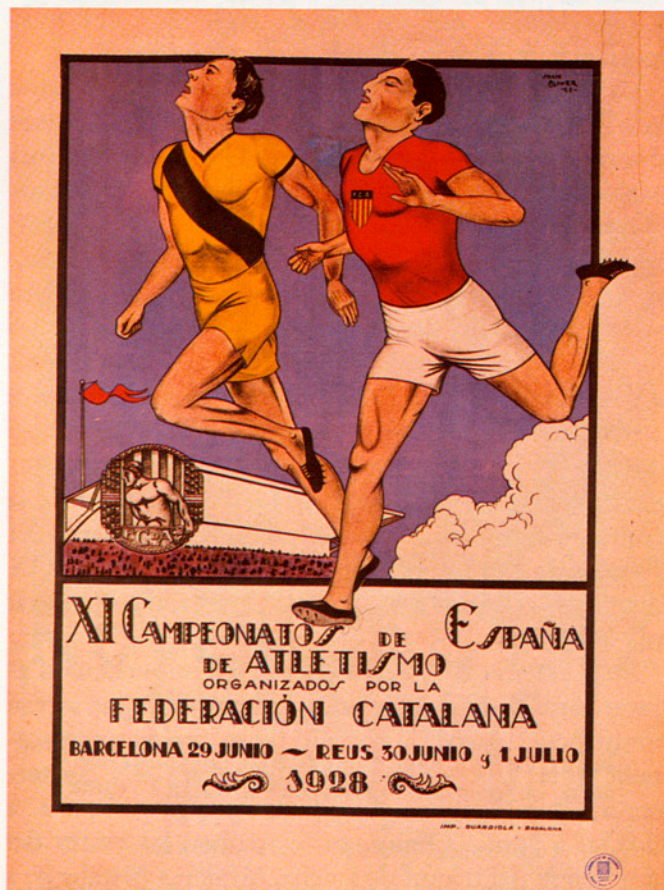
L'ATLETISME, ESPORT BASE, TÉ A CATALUNYA UNA LLARGA TRADICIÓ