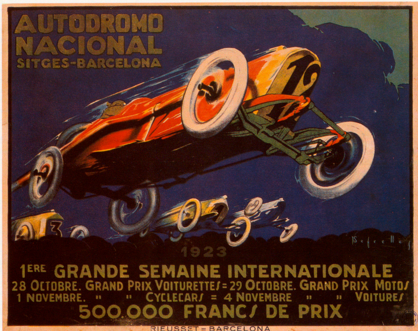
L'AUTOMOBILISME TAMBÉ GAUDÍ DEL FAVOR DEL PÚBLIC

actual. Es trobava en el que avui és la cruïlla amb el carrer d'Avinyó. El terme arenaria ve del fet que els amfiteatres eren designats com arenas . Aquest fou, per tant, el primer estadi conegut a Barcelona.