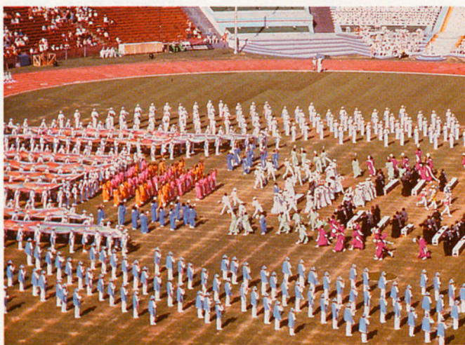
ELS MOVIMENTS ECONÒMICS UN FENOMEN OLÍMPIC PER EXCEL·LÈNCIA