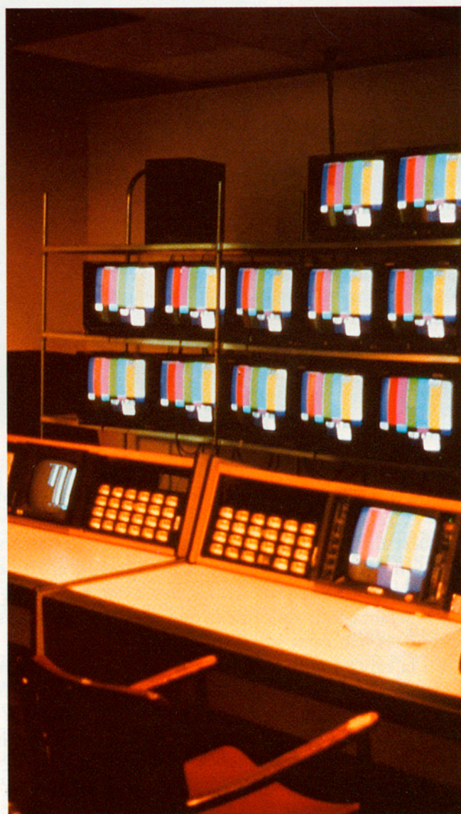
BARCELONA'92, UNA PROJECCIÓ INTERNACIONAL A TRAVÉS DE LA IMATGE

Des de la segona perspectiva suara esmentada, la celebració dels Jocs tindrà, a més, unes conseqüències econòmiques a mitjà i llarg termini l'abast de les quals és més difícil d'avaluar, però que, tanmateix, seran indiscutiblement importants. Aquests efectes es produiran previsiblement més en el camp de l'economia privada que no pas en el de l'actuació pública. Tot i això, les infraestructures de tot tipus realitzades per l'Administració són la base d'aquest desenvolupament econòmic complementari.