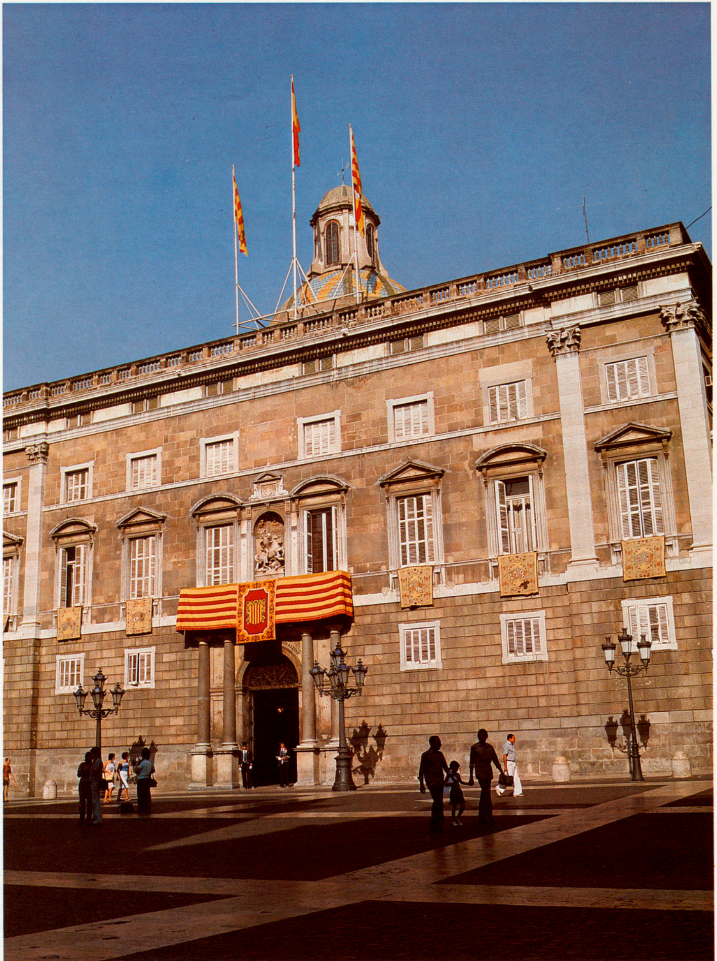
LES INVERSIONS PER CÀPITA A BARCELONA SUPERABAN, DE LLARG, LA INVERSIÓ CONJUNTA DE L'ADMINISTRACIÓ CENTRAL I LA GENERALITAT