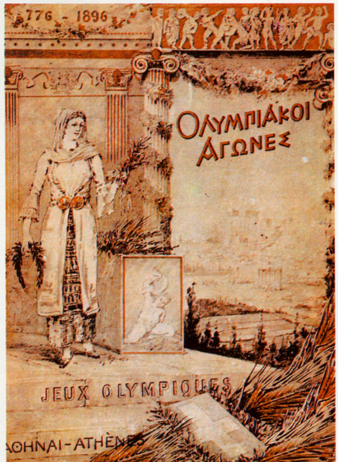
ELS PRIMERS JOCS DE LA MODERNITAT JA SÓN MOLT LLUNY

De fet, la demostració per la via empírica seria extremadament senzilla. Fóra suficient apel·lar a l'experiència personal de tots aquells (que som molts) que en algun moment de la seva vida han practicat l'esport, al pati del col·legi o amb un equip de fàbrica, a la plaça o al club de tennis, perquè s'imposés l'evidència. No cal pensar en competicions més o menys organitzades. El que, de bon matí quan els estels es ponen, dona la volta a la mansana corrent amb la llengua fora, està governat per un neguit ben definit: fer-ho millor que ahir: menys temps, més distància, etcètera: competeix amb si mateix. El que el dijous al vespre s'entreté jugant a futbol sala amb un grup d'amics manté sempre la il·lusió de guanyar, i si s'establís de jugar sense comptar els gols, ben aviat s'hauria desfet l'equip, perquè no hi ha futbol «no hi ha esport» sense possibilitat de victòria. El que puja muntanyes, «esport per excel·lència dels bons costums i de la moralina de la millora del cos i de l'esperit», fa col·lecció de cims i després d'haver-ne fet un ja pensa en un altre de més alt o més difícil. I així successivament.