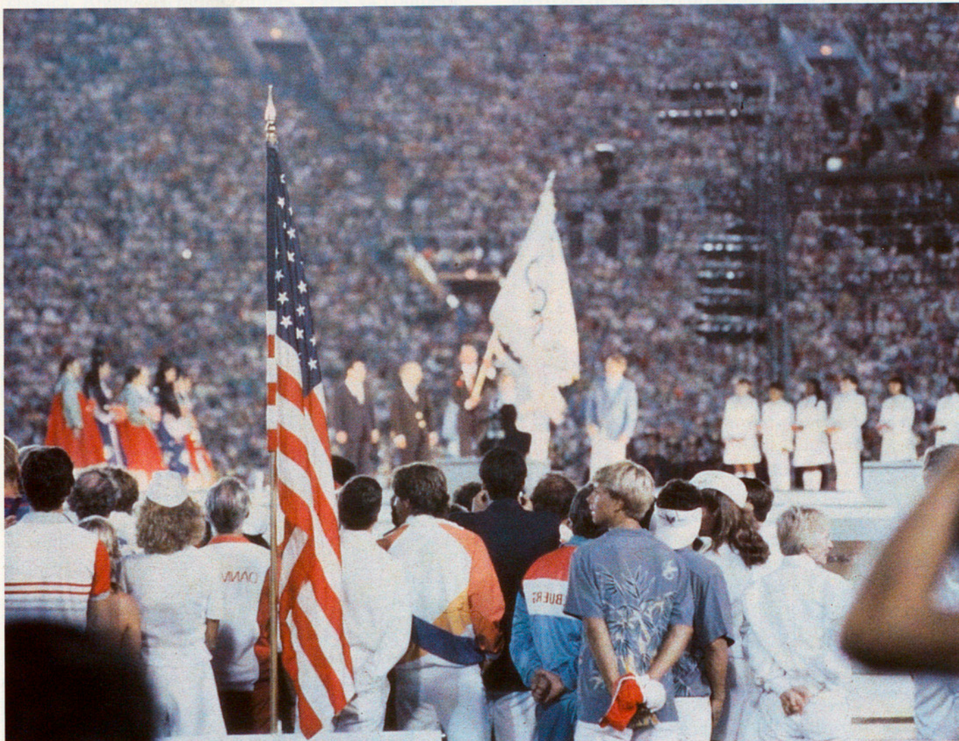
QUINA ÉS LA FUNCIÓ SOCIAL DE L'ESPORT?

col·lectiu d'aficionats amb els protagonistes. El punt de contacte és, evidentment, la victòria com a aspiració.