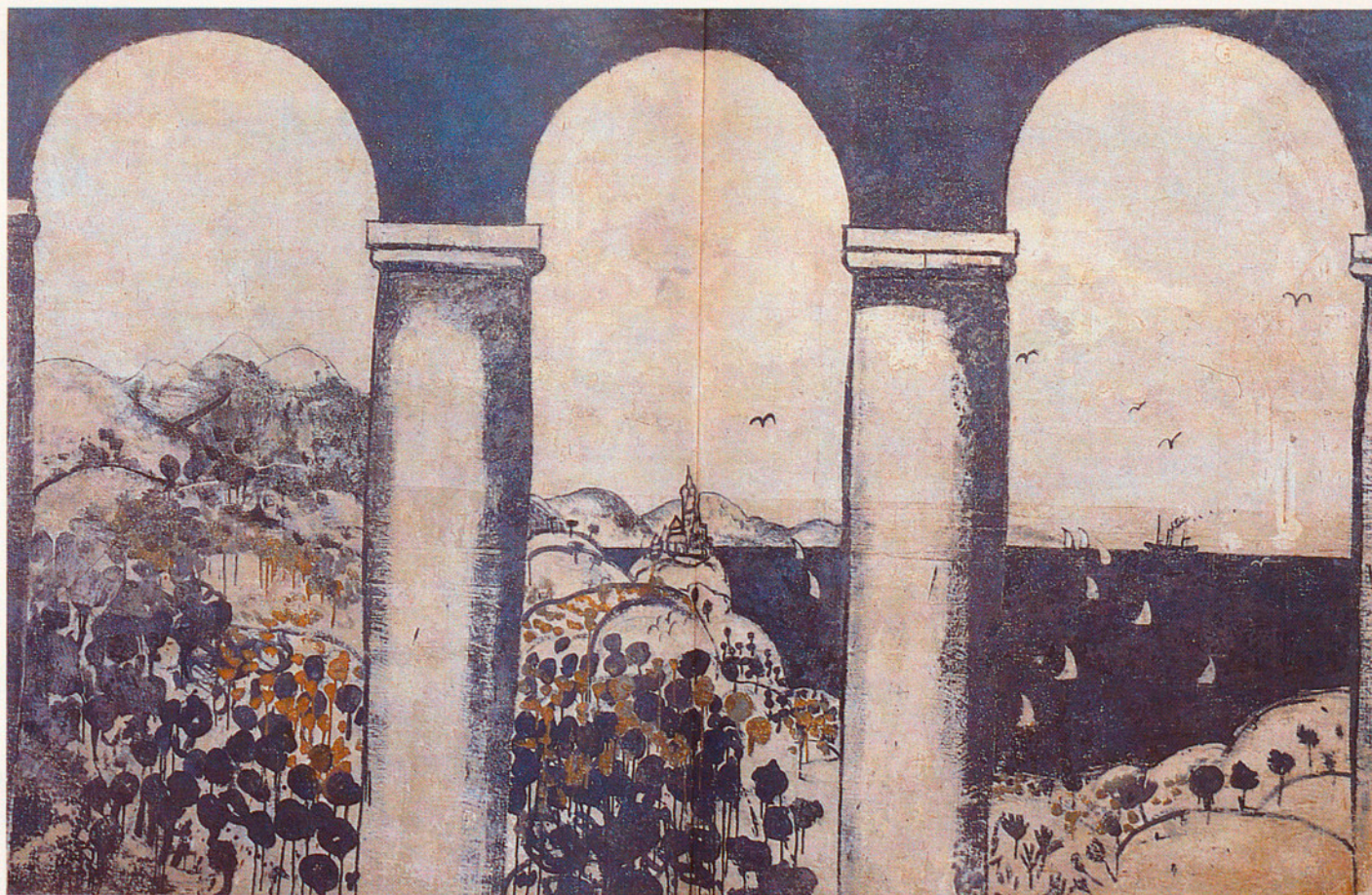
ELS ARTISTES CATALANS VAN CONSIDERAR L'ESPORT DES DE PERSPECTIVES BEN DIVERSES

En aquest sentit, el cas de Catalunya resulta exemplar. Sobretot quan el Principat va jugar un paper de capdavanter en la introducció de moltes disciplines esportives que, d'altra banda i fins fa ben poc si és que encara no ho són, eren minoritàries o simplement ignorades a la resta d'Espanya.