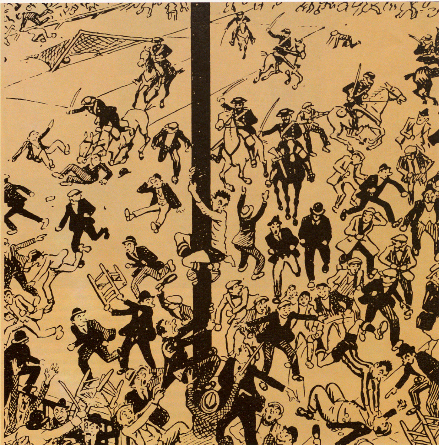
ELS DIBUIXOS D'OPISSO JA RECOLLIEN ASPECTES QUE AVUI HAN ESDEVINGUT MASSA HABITUALS

actituds amb què es pot afrontar la qüestió. D'aquesta manera veiem com artistes com Opisso i Pla deformen fins al grotesc les circumstàncies en què es produeix una determinada activitat esportiva. O bé, com Carles Sindreu, practicant del tennis, cronista esportiu, intel·lectual i poeta, escriu a més a més La singular història d'un club de tennis , el de la Salut. També hi trobem J. V. Foix, afeccionat a l'aeronàutica i la natació, que les introdueix com a element de modernitat. Joan Vinyoli o Narcís Comadira fan servir l'esport com al·legories «de la dramàtica condició de l'home». O, com en el cas de Pere Quart, Joan Oliver, que condemna l'actual idolatria de l'esport.