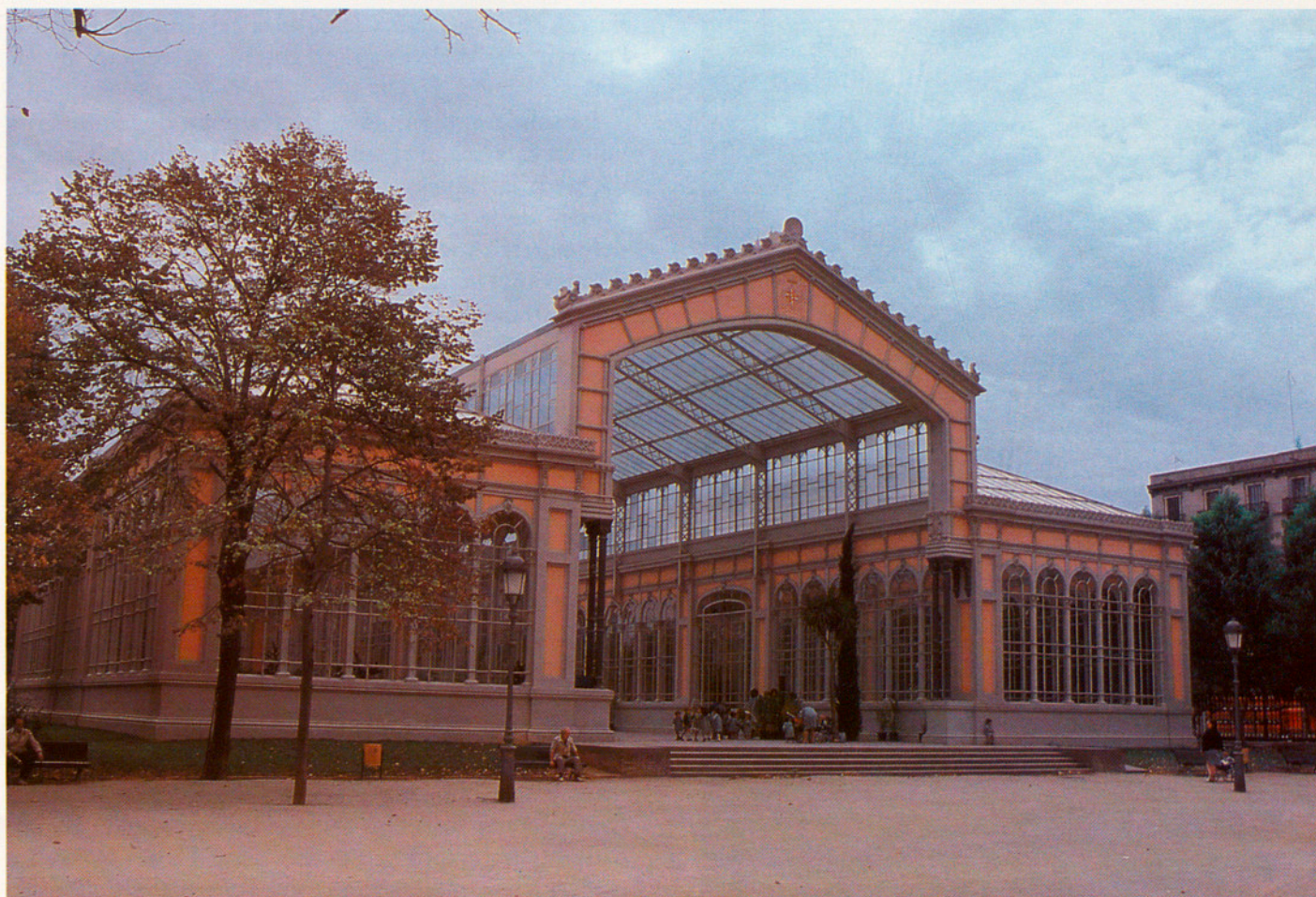
UNA CIUTAT FETA PELS SEUS CIUTADANS MÉS QUE NO CAP ALTRA