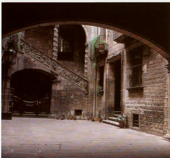
EL CARRER MONTCADA ÉS UN EXEMPLE DE LA SÍNTESI DE TRADICIÓ I MODERNITAT

llengua d'alta cultura. Cal recordar, però, que, si la llengua i la cultura catalanes han pogut subsistir i consolidar-se al marge, i sovint en contra, de tot suport estatal, això no és només per causa del seu valor intrínsec, ni de l'existència d'una poderosa i incorruptible identitat catalana, sinó, en gran part, gràcies a l'existència i vitalitat d'una ciutat com Barcelona que, malgrat la seva marginalitat política, ha estat una ciutat oberta, dinàmica, receptiva, cosmopolita, integrada als processos europeus de modernització econòmica i social, quan la resta d'Espanya es replegava sobre si mateixa i al voltant de valors, actituds i formes d'organització social i producció econòmica obsoletes en una societat moderna.