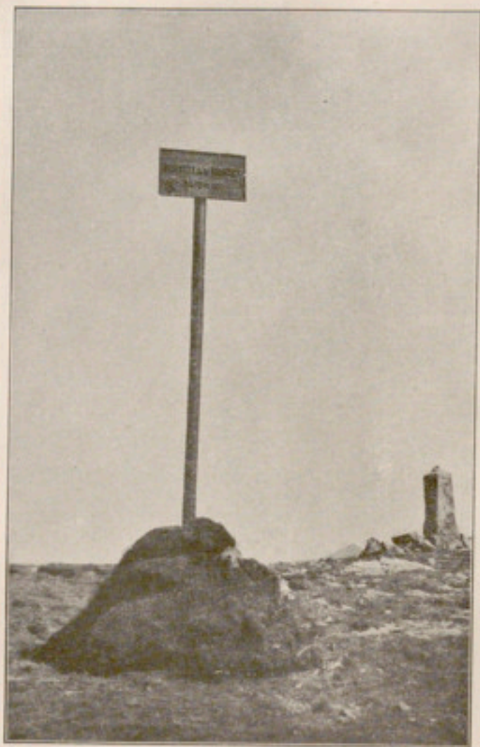
Fig. 3. — Fites indicadores de refugi, fonts, etc.