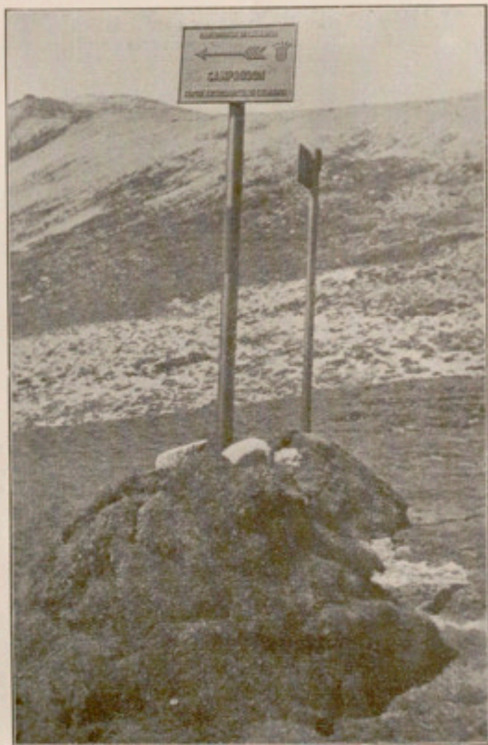
Fig. 1. — Fites amb indicacions de camí