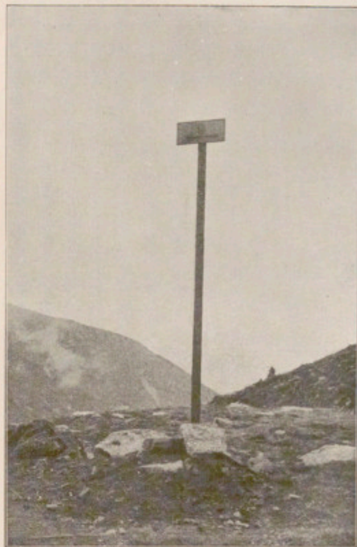
Fig. 4. — Fites amb fletxa indicadora de la direcció a seguir