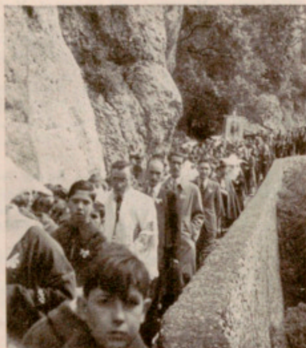
Las secciones de niños en el camino de la Cueva

rales. Reflejo de las espirituales que brinda cada corazón.