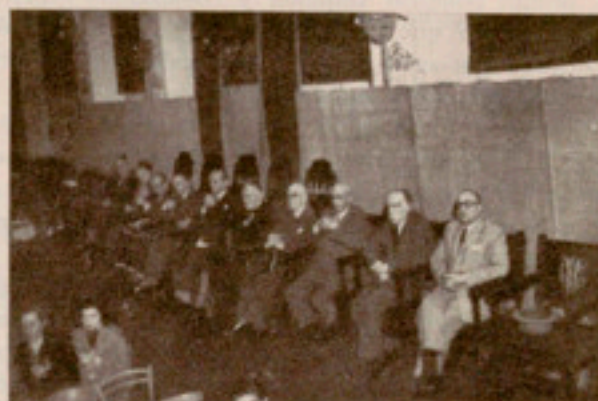
La presidencia en el acto

día 7 del pasado mayo, una fiesta altamente atractiva y variada, que se dignó presidir, acompañado por la