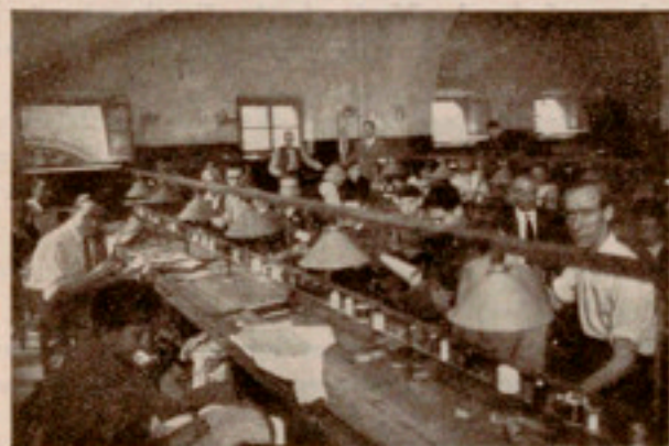
Taller de Sastrería

Al otro lado, el piloto de la nave: el jefe de taller. Con tiza y escuadra, cinta métrica y una sostenida atención, marca prendas, que unas fabulosas tijeras