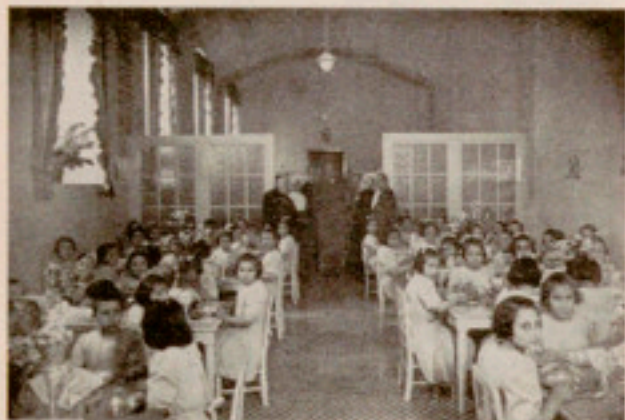
Uno de los nuevos comedores