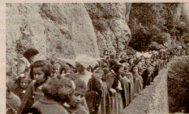
Las niñas camino de la Cueva

El camino de la Cueva se puebla de flores corpo-