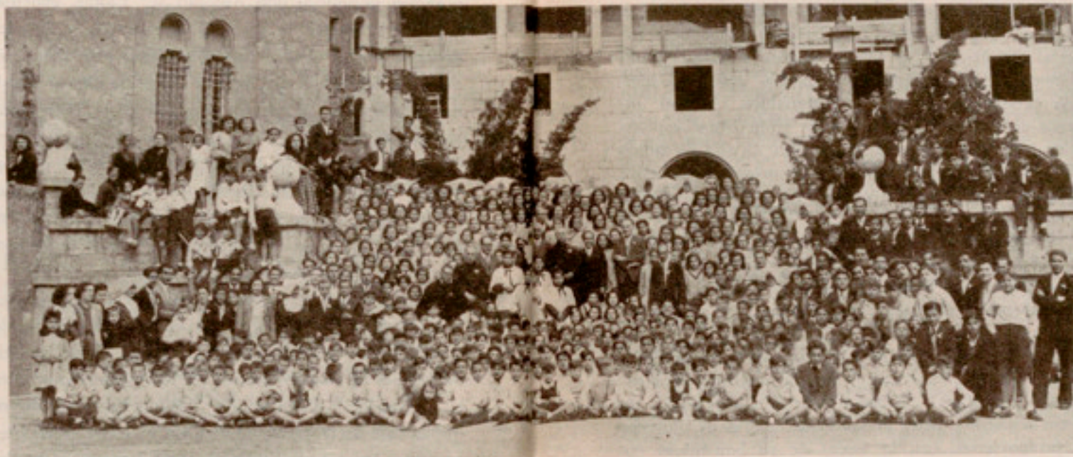
Nuestra peregrinación: la máquina fotográfica