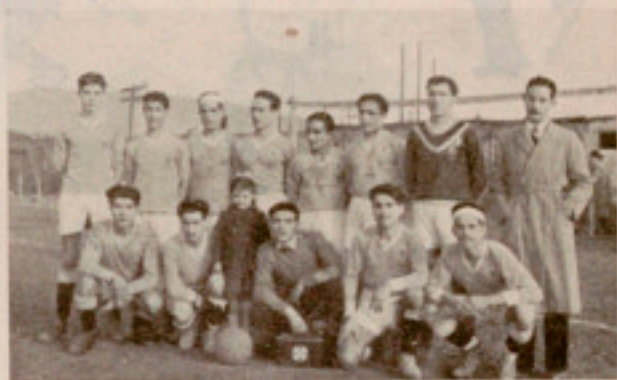
Los muchachos que constituyen el equipo de la Casa

frentado con el Club D. Aurora, Sordomudos, Dipucer, Casa Antúnez, Tecla Sala, Deportivo Aurora y Pueblo Seco. De todos estos partidos, jugados en campo ajeno, hemos sido vencidos tres veces, ganando tres más e igualando a 2-2 con el Tecla Sala, en Hospitalet. Hay que señalar la victoria lograda en