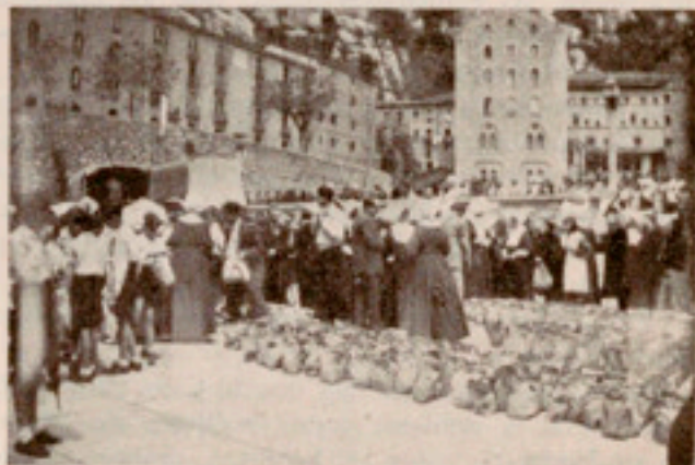
Reparto de comidas en una de las plazas

Parecía que faltaba a la peregrinación algo, un remate digno de la Casa. Y este remate lo puso delicadamente la Madre Superiora, al organizar para las mujeres impedidas — las menos impedidas, naturalmente— una expedición en cómodo autocar, para el día 1.º de junio. Treinta y nueve de ellas, acompañadas de varias religiosas, salieron de la Casa, después del desayuno, para llegar a Montserrat antes de las once. Pasaron varias horas admirando la Basílica, orando ante la «Moreneta»; contemplando la majes-