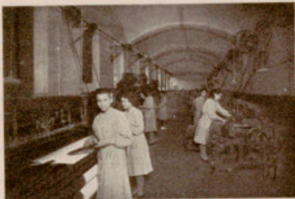
Los telares en funcionamiento

Los Cerrajeros ayudaron a instalar una granja moderna y están a su cargo todos los trabajos propios de su especialidad que precisa la Casa.