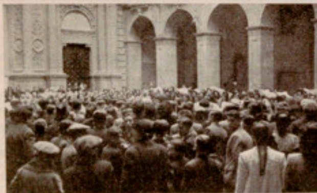
Concierto por el Orfeón Infantil

Iban acompañados por los capellanes, religiosas, maestros y ayudantes de las diferentes secciones. Ya en el Monasterio, fueron recibidos por la Escolanía, con Cruz alzada y el preste; entrando luego los peregrinos en la Basílica, donde el Padre Rosés les