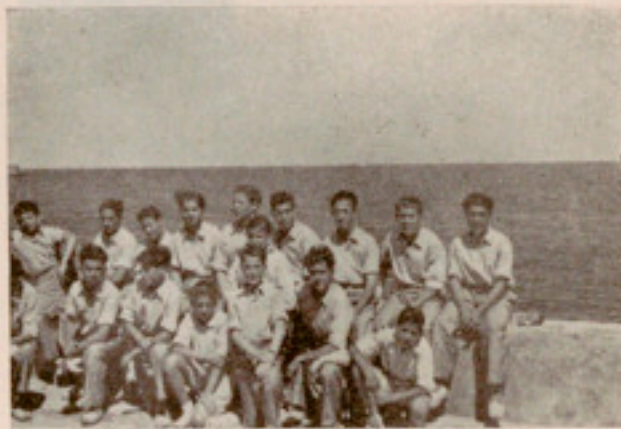
Puerto de Castro-Urdiales

Por la tarde, en la plaza de toros, tuvo lugar un festival parecido al de Algorta. Deligioso para todos, castreños incluidos, que además participaron en él.