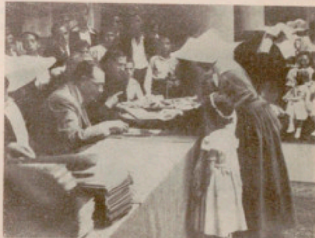
En la fiesta de fin de curso escolar

En uno de los salones de la Casa quedaron expuestos también aquel día las labores efectuadas por los asilados de ambos sexos y clases varias, por cierto