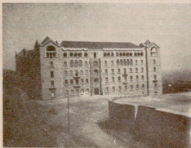
«Hogar Montaña», que ha acogido a nuestra niñez