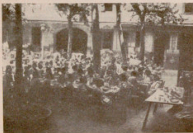
Una de las secciones durante el banquete