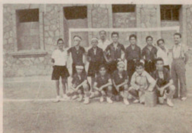
El equipo, también de la Casa, ganador de la Copa

con varias religiosas, presididas por la Rda. Madre Superiora, cantando con devoción diferentes cánticos eucarísticos. Y al llegar a la citada capilla, el reve-