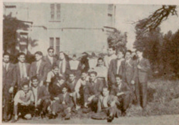
Residencia del Prelado diocesano en Begoña

Desembarcamos en el muelle de Arriluce y nos bañamos en la hermosísima playa de Algorta. El Cantábrico no brinca. Hoy es una descolorida copia de nuestro manso Mediterráneo.