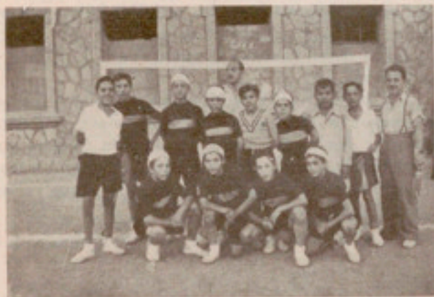
El equipo formado por nuestros escolares de la Escuela Industrial

Y llegó el final del veraneo, que se solemnizó con una brillantísima función religiosa celebrada la vigilia de la despedida, consistente en exposición del Santí-