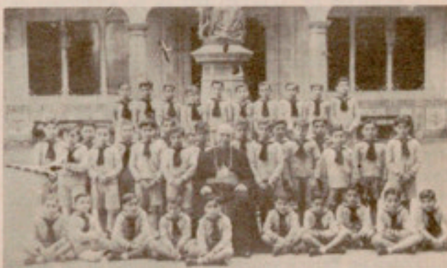
El Excmo. Sr. Obispo de Vitoria, en su reciente visita a la Casa

Y como fiel seguidor del divino Maestro, gustosísimo dejó impresionar, rodeado de nuestros niños, la presente fotografía.