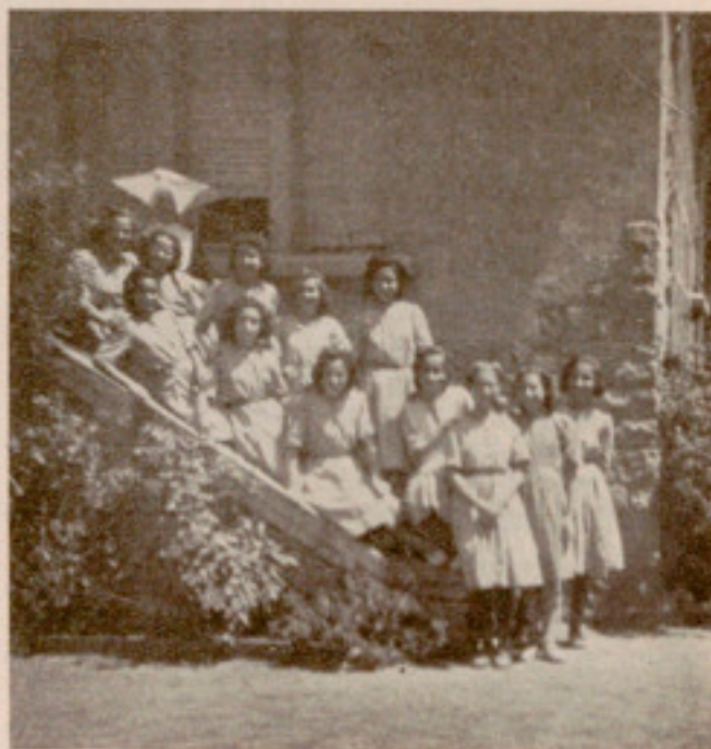
Grupo de estudiantes en la Casita de Caldas