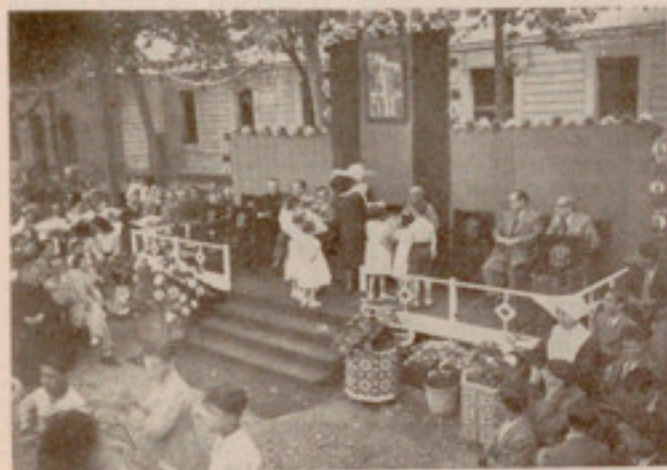
Del onomástico de la Madre Superiora. Presidencia del acto.