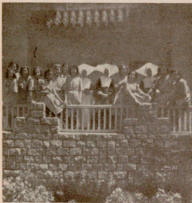
La Reverenda Sor Asistente, rodeada de las estudiantes, en su visita a Caldas

Comprendiendo la verdad de esas palabras y movidos del mismo amor a la juventud, los que dirigen esta Casa Provincial de Caridad han pensado propor-