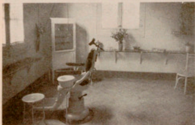
Gabinete de Odontología

Explica esta normalidad en los ancianos de ambos sexos, la vida metódica y tranquila que la Casa les proporciona, y en la niñez, los métodos higiénicos que se practican, desde la ducha diaria al baño frecuente, sin descuidar naturalmente la alimentación, que a pesar de las dificultades presentes que dejan sentirse no poco en este aspecto, la vida es nutritiva y suficiente. Lo indican con elocuencia irrefutable sus rostros sanos, la fortaleza con que soportan largas caminatas y, lo repetimos, la ausencia de enfermedades, ya que la misma tuberculosis, que da tantos casos, incluso en familias