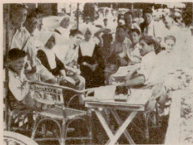
Campo del tiro de pichón, de Aiboa

Bilbao es rico; los edificios que acabamos de citar son señorialmente lujosos. Del Ayuntamiento destaca su salón de sesiones, de estilo árabe. En la Diputación hay una vidriera alegórica de las Artes y Oficios,