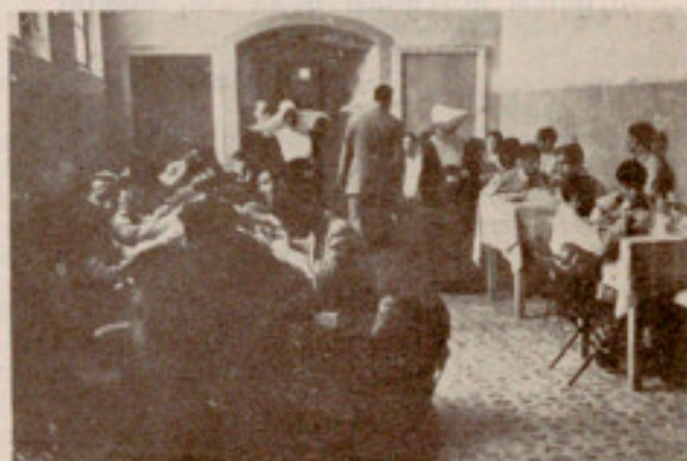
Los nuestros en los comedores de Bilbao