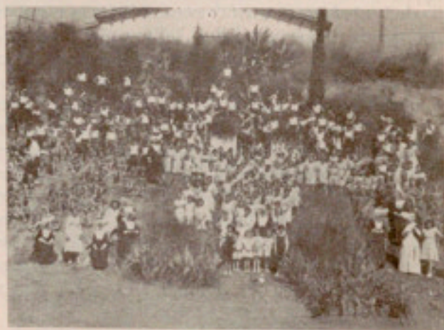
Nuestros pequeños en sus correrías por la montaña