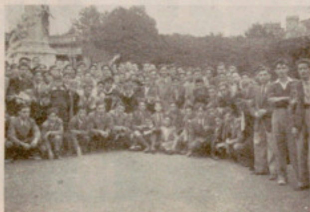
El Parque Municipal de Bilbao

«Hace siglos, exactamente desde 1695, que un relicario de plata con la cabeza del ínclito mártir San Mamés está en la iglesia zaragozana de Santa María Magdalena. Lo donó el Inquisidor de Aragón don