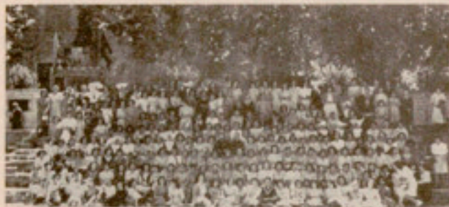
Las Hijas de María reunidas en San Cugat

presidido por el mencionado Director, al que acompañaron el que lo es de las Hijas de María de nuestra Casa, doctor Piquer; el Capellán de la misma, reverendo