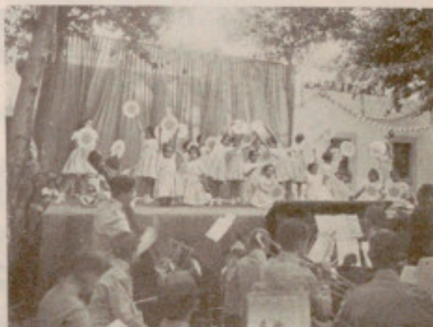
Un número de gimnasia rítmica

Y llega la tarde. El amplio y artísticamente ornamentado patio de los hombres, ocupado por todas las secciones de la Casa y por numerosos invitados, fué el sitio escogido para la celebración del magnífico festival