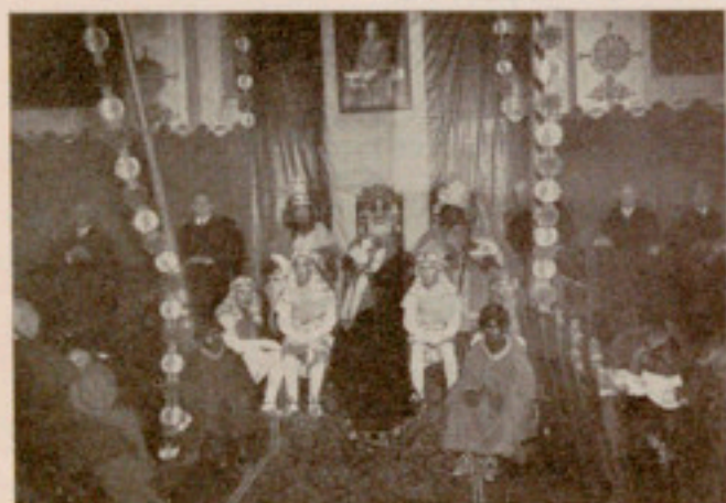
La presidencia en nuestra tarde de Reyes

Ciertamente que este número, por su tema y extensión, fué como la medula del festival. Dejó en el ánimo