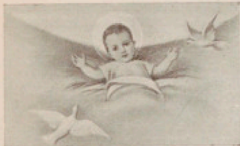
El divino Infante

Oficiaron los reverendos Capellanes, y el coro femenino cantó la Misa de Ribera, con acompañamiento del