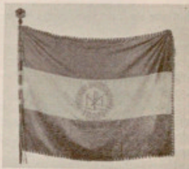
Bandera de la Congregación Mariana de Jóvenes de la Casa, bendecida solemnemente el día de la Purísima, Patrona de la Congregación. Está formada de una faja de damasco de seda blanca entre dos del mismo tejido de color azul celeste. En el centro tiene el anagrama de las Congregaciones Marianas, bordado al oro, y rodeado de la inscripción «Congregación de la Inmaculada Virgen María y San Luis Gonzaga», bordada en seda amarilla. Al reverso tiene el escudo de la Casa bordado en sedas y contorneado con la inscripción «Casa Provincial de Caridad-Barcelona», bordada en seda amarilla.

III. — Este año, en la fiesta vespertina, apareció erguida en el presbiterio una hermosa bandera azul-blanca, alta, rematada con el anagrama de las Congregaciones Marianas. Era la de la Congregación de nuestros jóvenes. No la tenían; y la Junta Directiva