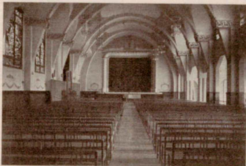
Aspecto parcial del Salón de Actos

En números anteriores se ha dado a conocer a nuestros amables lectores el desarrollo de la vida religiosa, escolar y de taller de los albergados, así como la asistencia médica de los mismos, ya que para una buena formación se requieren atenciones para el cuerpo no menos que para el espíritu. Vamos ahora a girar una visita a nuestro Salón de Actos, donde, armonizando el sano esparcimiento y el lícito pasatiempo con la formación de espíritus capaces de apreciar el arte y