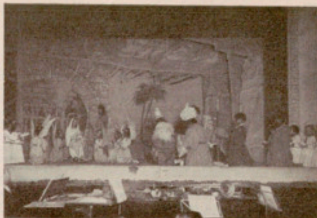
Un cuadro escénico de «Rindamos adoración»

La ronda es una encantadora creación. De las más características del autor. Cuatro niñas que encarnan