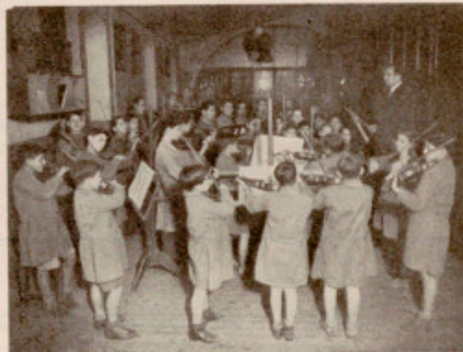
Nuestros artistas honrando a su Patrona

divino arte, se celebró un brillante festival en nuestro Salón de Actos, que presidieron, entre otros, el Presidente delegado doctor Oñós y la Madre Superiora. Participaron en dicho espectáculo los alumnos de la Academia Musical de Ciegos de la Casa, bien secundados por los de la Academia de videntes y por la sección infantil del Coro de Niñas. Los profesores de ambas Academias colaboraron desinteresadamente en tan lucido festival, así como otros elementos ligados con nuestra institución con lazos de afecto.