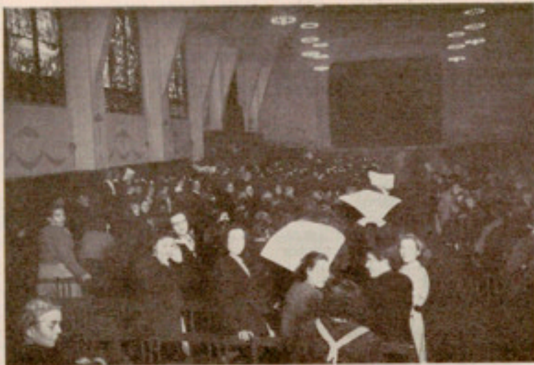
Aspecto del Salón de actos en el Festival Gabernet