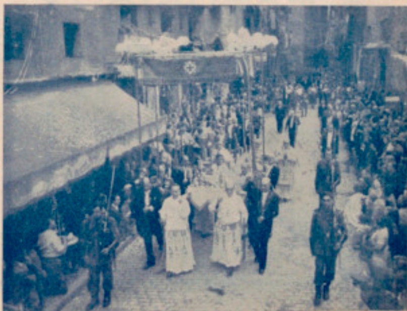
La Custodia a su paso por la calle de Valldoncella

Hemos podido presenciar este homenaje de fe y de amor por nuestras calles vecinas honradas con la visita de la Eucaristía albergada con noble humildad dentro las paredes centenarias de la Casa Provincial de Caridad. Casi veinticinco años sin poderse recrear en esta visita divina, añorábanla todas ellas. De aquí que al paso del Santísimo hayan volcado pedazos de su fe y trozos de su amor.