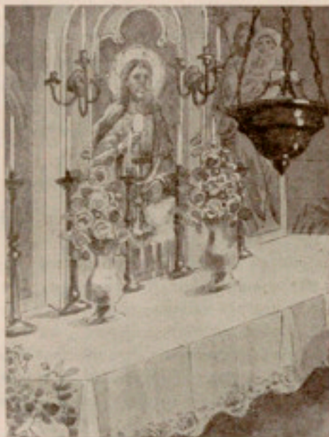
«Rece Panis Angelorum»

¡ Fiesta de la Primera Comunión ! Fiesta de las fies-