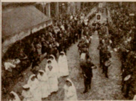
Tres aspectos de nuestra Procesión