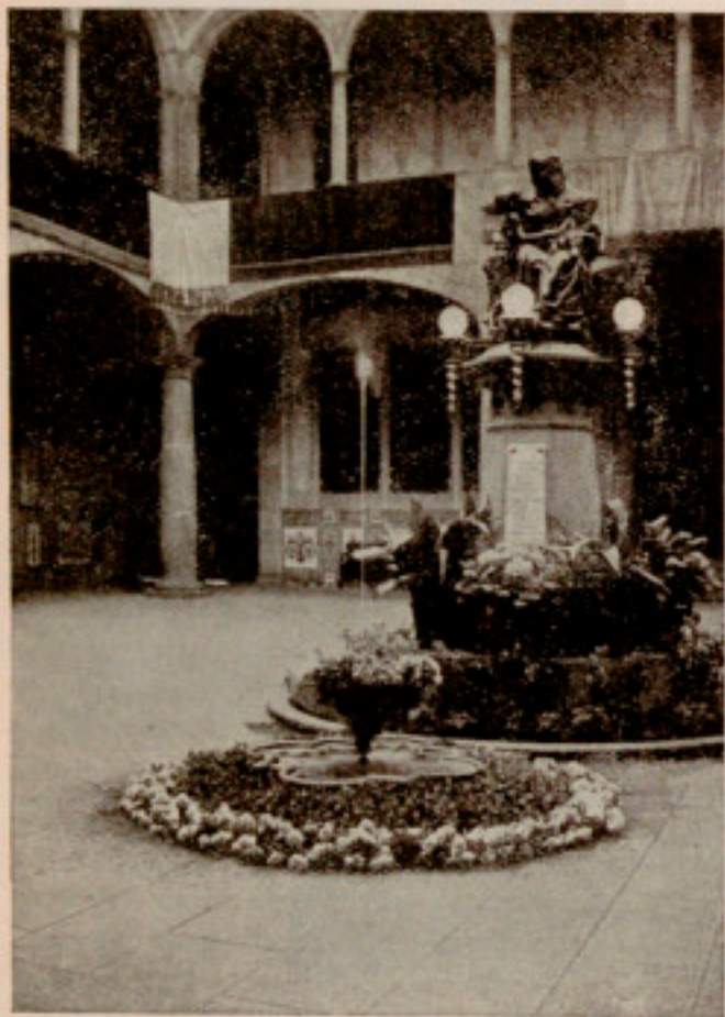
«L'ou com balla», en el Patio Manning

Recuerdo haber visto también un «ou com balla» fuera de tiempo: en el barrio de Santa Catalina, junto al Mercado, con motivo de la Fiesta mayor. Los entusiastas organizadores de los actos, para dar una nota