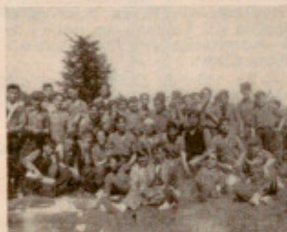
Nuestros aprendices, en la Conrería

Venciendo en todos los encuentros restantes, se terminó la liguilla en