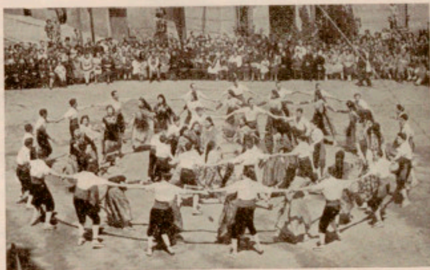
«L'Esbart de Dansaires Montserrat Martinencs»