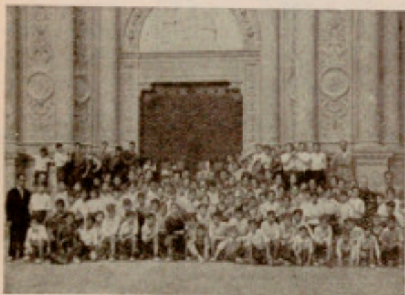
Ante la Basílica

Dejando que el metro siguiese su monótona ruta, subíamos, bajo la gufa protectora de nuestros jefes, al tren que en la plaza de España nos estaba reservando