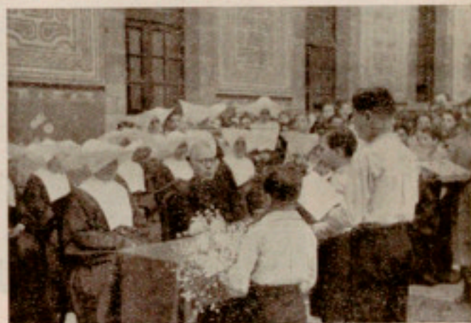
La Madre Superiora recibiendo las felicitaciones de la Casa

Acto seguido, en el patio de las niñas, la Madre