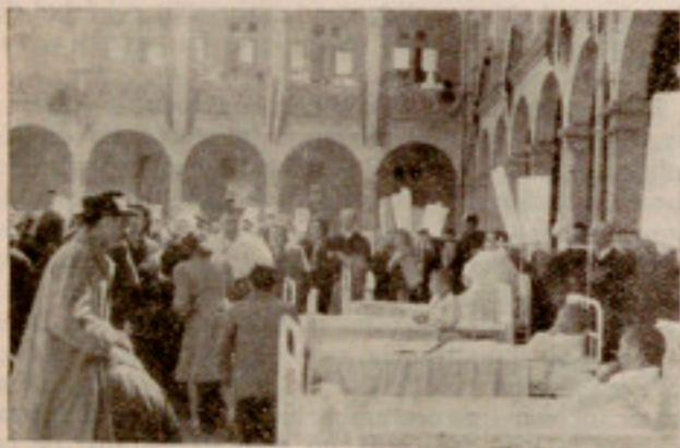
El señor Obispo de la Diócesis en el Asilo de San Juan de Dios, a la salida del solemne Pontifical celebrado el mes de marzo para conmemorar el centenario

Nació San Juan de Dios en Montemayor el Nuevo, el año 1495, hijo de padres humildísimos. Pastor en sus primeros años, soldado más tarde, deja su patria para vivir en España, fijando su residencia en Granada. La palabra ardiente del P. Juan de Ávila trocó su corazón mundano para transformarlo en un corazón de santo, y de santo de altos vuelos. Las vivas y certeras pinceladas del apóstol de Andalucía pintando las amarguras del placer y las glorias del sacrificio y del dolor, son el comienzo de una nueva vida totalmente dedicada al servicio de Dios y de los que padecen. Es tenido