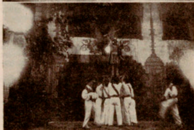
Dos momentos de la Fiesta folklórica