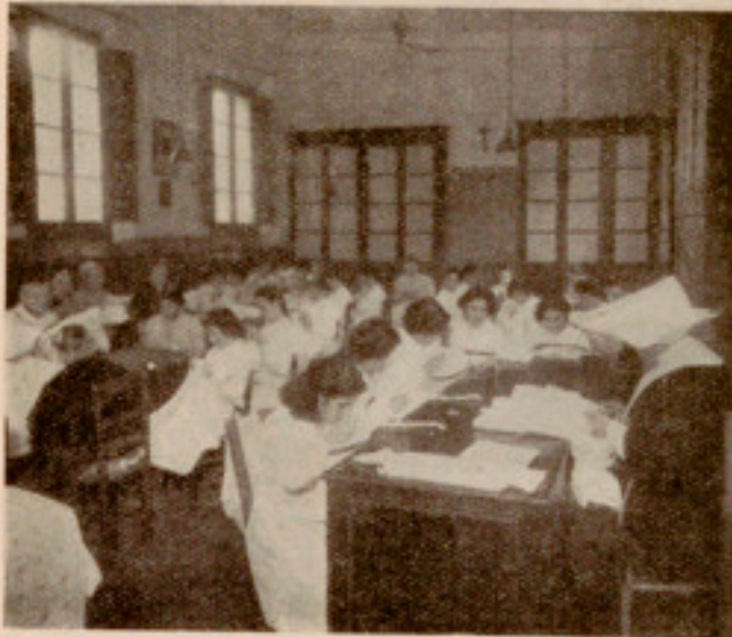
El llamado Obrador

hemos de concretar, desde estas columnas, que quizá la mejor parte del éxito que obtienen los muchachos por sus vestidos, lo han elaborado, con sudores y fatigas, en este Planchador, las oficiales y aprendizas albergadas que, fijas o eventuales, se encuentran desarrollando sus actividades en el mismo.