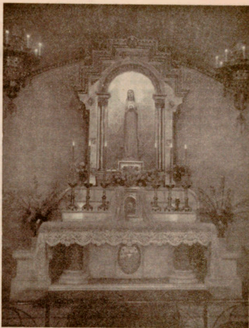
El nuevo retablo estrenado en la Capilla de las Hermanas