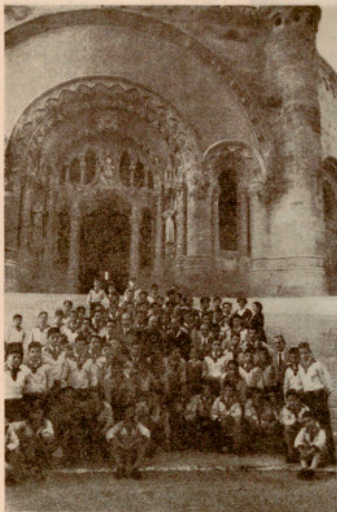
Ante el Templo votivo del Tibidabo

visitaron el santuario de Nuestra Señora de la Salud. En sus cercanías se les sirvió una apetitosa merienda, costeada por el Ayuntamiento.