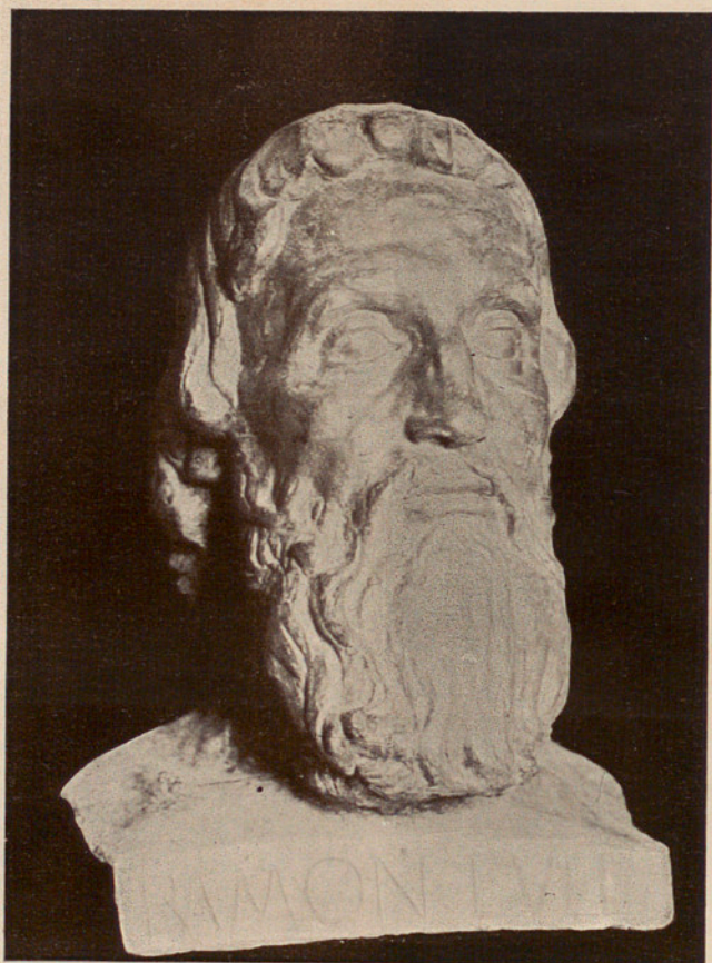
EL RAMON LULL DE L'INSTITUT