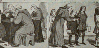
Charlemagne visitant l'Ecole de Palaise.