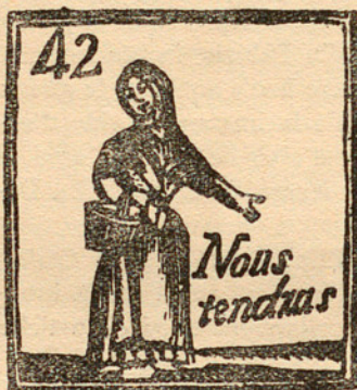
VINYETA DE L'AUCA DELS «BALADRÉS DE BARCELONA» (a mida original)

Tret remarcable : les escasses auques que sobreviuen, i so-