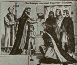
Charlemagne couronné Empereur d'Occident.

Après avoir réprimé en 769 une révolte de l'Aquitaine, il étiqua en 773 les Saxons qui révoltèrent, par de fréquents soulèvements, les provinces occidentales de son royaume. Cette guerre fut longue et sanglante, car c'est en 796 seulement qu'elle se termina par la soumission du grand chef saxon Widukind, et la conversion au catholicisme de ce peuple encore païen. Entre temps, Charlemagne, appelé le pape Adrien IV à venir sur les Lombards, demandait du secours, braché dans en 773 les Alpes, en Bavière, et reconquit le Lombardie après en avoir fait prisonnier le roi Didier. Puis, appelé contre les Sarrazins par les habitants du Nord de l'Espagne, il partit en l'année en 798, et soumit tout le pays compris entre un marabout et l'Ebre. C'est au retour de cette campagne qu'il fit le fait d'armes historique des pyramides d'Alhambra, où le Palais National prit, avec quelques modifications sans importance que lui, d'inspiration, toutes les formes que caractérise l'architecture de l'art de France. Bâti et ses successeurs furent jusqu'à présent, sans l'année fin assés.