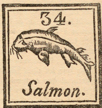
VINYETA DE L'AUCA «COLECCIÓN DE PECES» (reimpressió de 1864) (a mida original)

bretot, totes les que es reimprimeixen, són de caràcter religiós. Les úniques que es venen pels carrers són les de vides de sants o les de processons, durant el curs o bé a les portes de les esglésies, en festivitats d'anomenada (Corpus, Dimecres de Cendra, Dijous Sant, Santa Eulària, etc.). Això ja insinua, de primer antuvi, que el poble respondria al ressorgiment d'una imatgeria religiosa, que no fos mera reedició, sinó dibuixada de bell nou i impregnada d'un caràcter més amplement artístic.