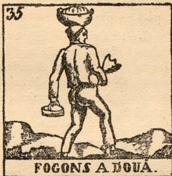
VINYETA DE L'AUCA «BALADRÉS CATALANS» (principi del segle XIX) (a mida original)

Salutations de la Lletania (encara avui intra commercium ), les d'Història Sagrada, les vides de Sants (de les quals la de santa Eulària encara es reimprimeix, igual que la de sant Vicents Ferrer, amb peu d'impremta de la casa Hernando, de Madrid).