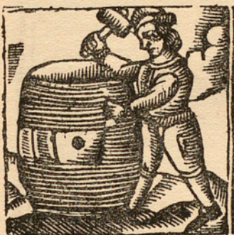
VINYETA DE L'AUCA «ARTES Y OFICIOS» (segle XVIII, reimpressa en 1863) (a mida original)

les dues conegudes cases editores d'auques, la d'En Joan Llorens, del carrer de la Palma de Santa Catarina, i la de l'Antoni Bosch, del carrer del Bou de la Plaça Nova, representant les processons de Corpus, Setmana Santa, algunes de les varietats de les quals són reimpressions de boixos dels principis del XIX (a mencionar la del Beat Oriol, 1807), les Flores de la Doctrina Cristiana i les