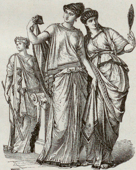
VINYETA D'UNA AUCA DE MUNIC DE LA HISTÒRIA DE LA INDUMENTÀRIA Dibuix d'A. Muller