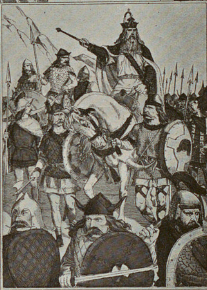
Charlemagne passe les Alpes au Mont-Cenis pour secourir le pape Adrien IV.

Charlemagne employa les années suivantes à réprimer la révolte des Bretons; à réprimer les Grecs qui menaçaient en Italie le pape Adrien; à terminer le soulèvement de la Sicile; à repousser les Huns et les Normans jusqu'aux confins de l'Empire; d'élire, et à poursuivre la Reconquête jusqu'à la Garonne et le Saragossa. Sa puissance militaire et morale fut à son apogée, quand, à un voyage qu'il fit à Rome pour visiter le tombeau de Louis III, le pontife le sacra Empereur d'Occident le 25 décembre 800.