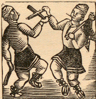
BOIXOS DE L'AUCA DE LA FESTA MAJOR gravats per Enric C. Ricart (Barcelona, 1920)

(Gentilment cedits per l'editor Oliva de Vilanova)