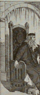
Charlemagne dictant les Capitulaires.

Après tant de guerres lointaines, Charlemagne se reposa de ses fatigues à Aix-la-Chapelle, dans un travail de construction poétique, quand une épidémie emporta le 28 janvier 814, dans sa 71ème année, après un règne glorieux de 46 ans, dont l'histoire nous a laissé un témoignage précieux.