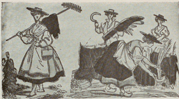
DIBUIXOS DE PINOT EN UNA AUCA ANTIGA D'EPINAL «DECORS CHAMPÊTRES»