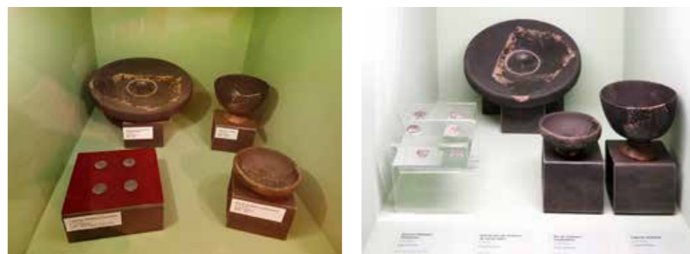
17.2 Sales d'exposició. Vitrina abans de la intervenció (esquerra) i després de la intervenció (dreta), on ja s'ha efectuat la restauració de les monedes i el canvi de sistema expositiu

Fruit d'aquest estudi - assessorament, i tenint en compte tant les prioritats pel que fa a conservació-restauració com les necessitats concretes dels tècnics del Museu, es van restaurar 28 de les 59 peces metàl·liques procedents de les sales d'exposició. Actualment, les que presentaven problemes més greus de conservació ja s'han intervingut. L'any 2020, es van restaurar una medalla de plata, una fíbula de bronze i un conjunt d'onze dracmes a les quals, a més, es va confeccionar un nou sistema expositiu. L'any 2021, es van restaurar una punta de fletxa, una fíbula i una espàtula, totes de bronze i d'època ibèrica. I, finalment, l'any 2022, dotze monedes de bronze i plata d'època medieval i moderna.