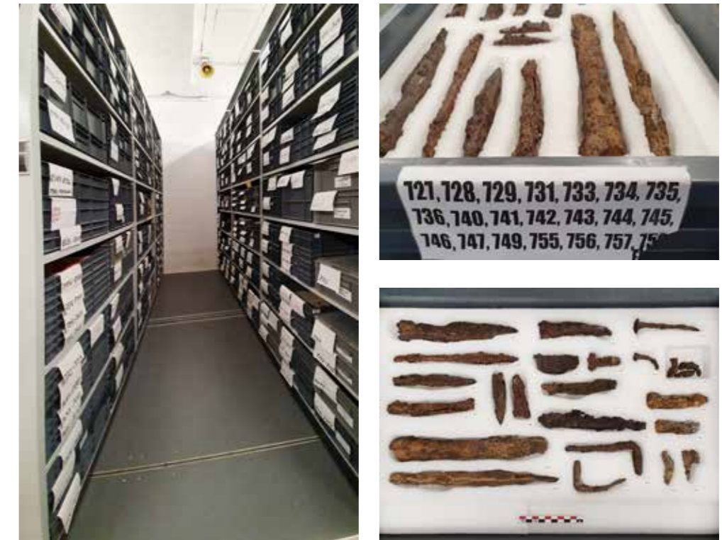
17.1 Sales de reserva i exemple d'una de les caixes norma Europa que contenen peces de ferro